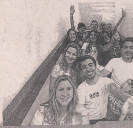
Eles vão com os amigos

É mais organizado e achei que os pacotes seriam mais baratos do que se eu fosse por conta própria.