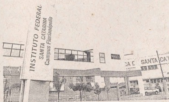
Campus da IF-SC em São José recebeu a nota 595,2 na avaliação do Enem

Favaro – Se pegarmos a média do Estado no Enem e compararmos com a de SP, por exemplo, SC ainda tem uma média melhor. Para o aluno daqui, o Enem ainda não tem tanto peso para o vestibular, porque ele conta como parte da nota de entrada para as universidades públicas mais procuradas que são as federais de SC e do Paraná. A partir do momento em que o Enem tiver mais peso para entrar nas universidades da região, as notas subirão.