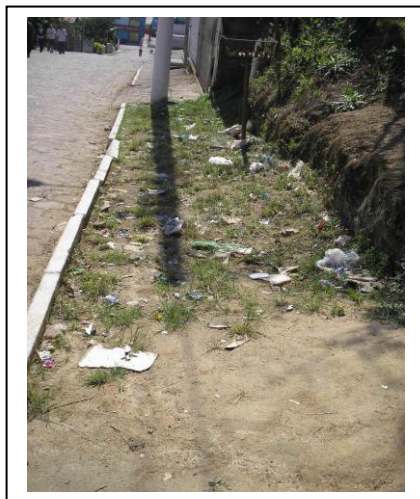
Figura 1: Lixo em uma das ruas visualizado durante um passeio pelo bairro com os alunos.

Nesse sentido, a Análise do Discurso ao buscar compreender as condições de produção dos discursos traz elementos que contribuem no entendimento destas questões e auxilia na elaboração de práticas pedagógicas que perpassem estas discussões.