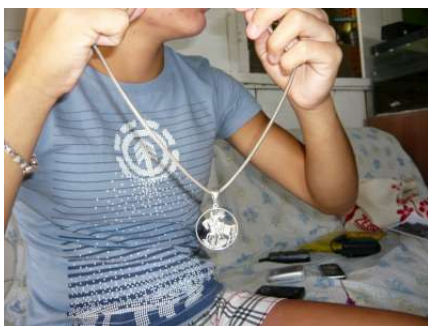
Figura 8.9: Corrente de São Jorge