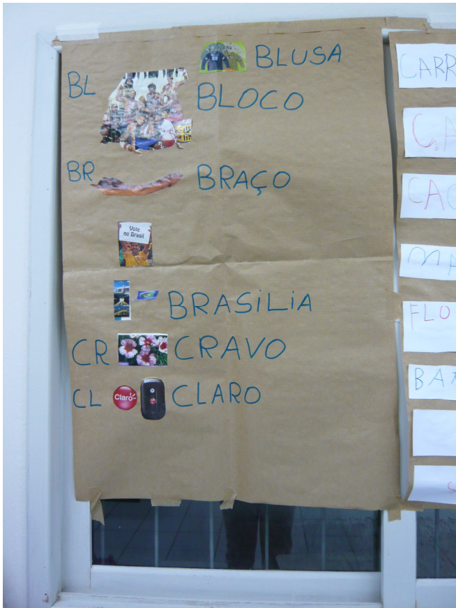
Figura 3.1 Cartaz utilizado nas aulas de alfabetização para adultos no Morro São Jorge inclui referência à operadora de telefonia celular