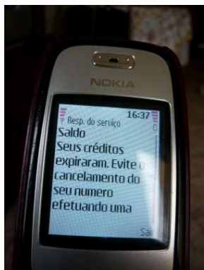
Figura 5.5: Mensagem recebida constantemente por um celular pai-de-santo

recebe” na verdade estamos falando de um celular que é pouco utilizado para fazer chamadas tarifadas, mas que possui créditos válidos. A estratégia é economizar ao máximo o baixo valor em créditos que se coloca mensalmente (dez, quinze ou vinte reais em média) para que seja possível fazer ligações a cobrar do aparelho. Pois o detalhe técnico importante é este: não é possível fazer chamadas, sejam tarifadas ou a cobrar, de um celular que não possua créditos válidos. A única exceção são as ligações para números de emergência, que por força da lei brasileira passaram a ser totalmente gratuitas. Mesmo que alguns nem insiram créditos mensalmente, mas sim de três em três meses, farão