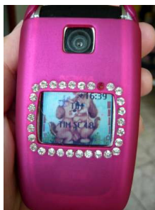
Figura 6.28: Celular da filha de Manuela

O equivalente feminino da captura de imagens de imagens também existe. Como vimos na seção deste capítulo em que escrevi sobre celulares e moda, as adolescentes adoram enfeitar a parte exterior dos celulares com adesivos de personagens de