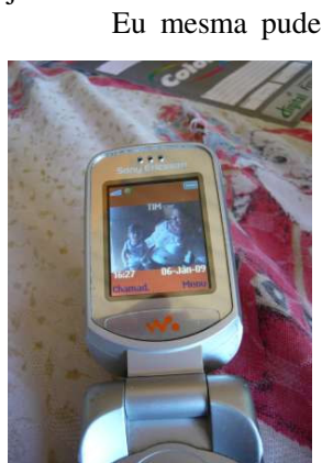
Figura 6.25 Celular de Janaína com fotografia antiga

digitalizar imagens analógicas (fotografias ou quadros, por exemplo) desta forma transpondo o físico para o digital. Janaína, por exemplo, tem algumas imagens de seu filho caçula quando bebê no celular, mas queria uma do filho mais velho. Não teve dúvidas: conseguiu o que queria captando uma imagem com o celular de uma fotografia impressa, mais antiga (Figura 6.25 e na abertura deste capítulo). Já Nena apontou a câmera de seu celular para uma antiga fotografia sua com o pai, quando ela tinha oito anos. Nena explica que a foto é muito importante para ela pois foi representativa na época da separação de seus pais: “Essa foto foi tirada numa das épocas de uma das brigas do pai e da mãe. Eu tava com ele lá em Blumenau, mas ô! Ele não deixou que eu viesse embora com a mãe”. Além disso, quando me mostra a imagem, me diz emocionada: “De vez em quando o celular fica cheio, mas essa aqui eu não apago de jeito nenhum”.