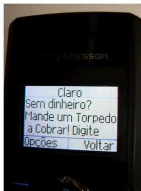
Figura 5.7 Mensagem de operadora oferecendo o serviço de torped a cobrar