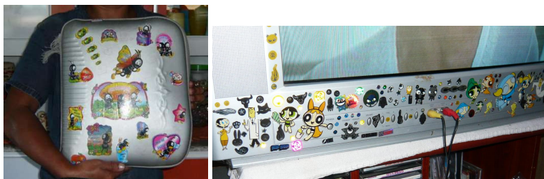
Figuras 6.8 e 6.9: Pasta pessoal adornada com adesivos evangélicos; TV de 29 polegadas pacientemente adornada com adesivos coloridos.