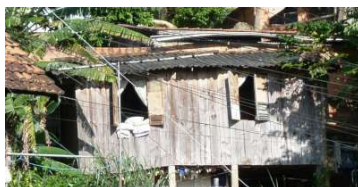
Figura 0.2 Casa de Marisa - detalhe

que esta pendesse para um dos lados, conforme mostra a imagem que abre esta introdução (Figura 0.1) e em maior detalhe na Figura 0.2. Em suas palavras,