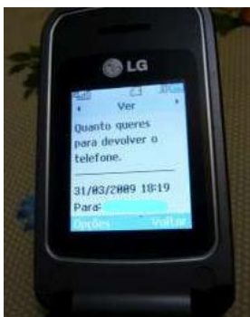
Figura 4.1: Torpedo oferecendo recompensa pela devolução de um celular roubado