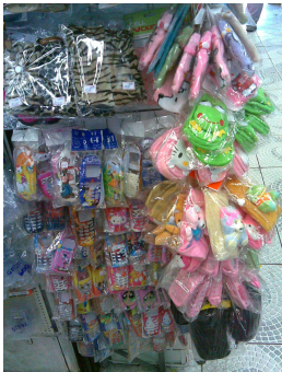
Figura 6.4: Capas para celular no Mercado Público