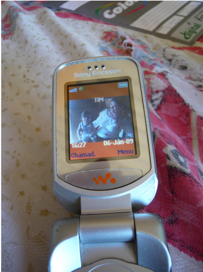
Figura 6.25: Papel de parede do celular de Janaína, com a foto de seu filho