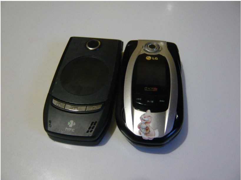
Figura 7.1 Um par de celulares pertencentes a um jovem casal do Morro São Jorge, Carina e Valmor