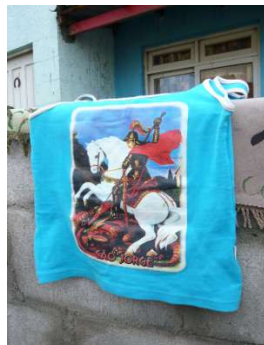
Figura 8.8: Camiseta com a imagem de São Jorge, ou Ogum