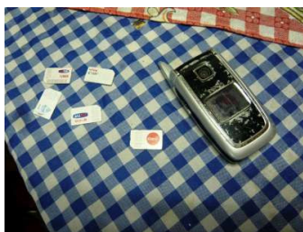
Figura 5.3: O celular de Ellen e seus cinco diferentes chips

Na época de meu trabalho de campo, a prática de ter vários chips estava no auge. Ana Beatriz opina: “Do celular, a melhor invenção foi o chip – e o pré-pago”. Essa combinação de um celular com o qual se pode inserir uma quantia pré-determinada com a possibilidade de falar a tarifas reduzidas, ainda que com restrições, era extremamente atrativa para vários de meus interlocutores 82 . Ellen, irmã de Larissa, combinava o uso de cinco chips de três operadoras diferentes. (Figura 5.2 e na abertura deste capítulo) Dirceu trabalhava como entregador de gás e chegou a ter três celulares com três chips diferentes para contatar seus clientes. Explica-me que antes tinha apenas um celular, mas que acabava perdendo ligações quando um cliente da TIM, por exemplo, lhe ligava e