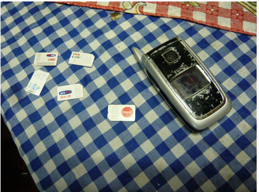
Figura 5.2 O celular de Ellen e seus cinco diferentes chips