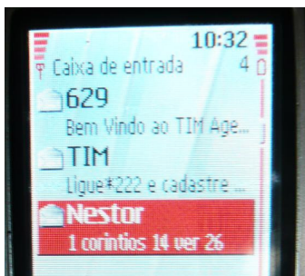
Figura 8.4: Torpedo evangélico com mensagem bíblica

Para passar “uma mensagem de fé” os evangélicos apropriaram-se da função SMS do celular: mandam trechos da Bíblia por mensagem de texto (Figura 8.4): “A mensagem é conforme o