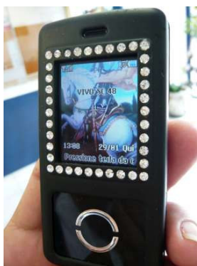
Figura 8.7: Celular de São Jorge