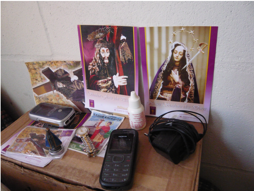
Figura 8.1 Na casa de uma umbandista que passou por uma grave cirurgia, os celulares da família dividem espaço com imagens de santos católicos no pequeno altar improvisado.