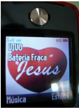
Figura 8.2: Celular com papel de parede evangélico