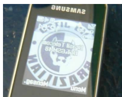
Figura 6.6: Celular com papel de parede mostrando imagem de jiu-jitsu

No caso dos homens, a personalização da aparência externa do celular, tal como descrita por Natasha, é vista como algo completamente feminino. Para Ricardo, para os homens a moda de “enfeitar o celular”