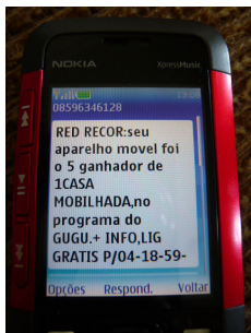
Figura 5.1 Golpe pelo celular anuncia falso prêmio

Por fim, os conflitos entre governo, operadoras e sociedade civil organizada também dizem respeito ao uso de celulares para a prática de crimes. Para coibir tais práticas, o governo brasileiro implementou, em 2003, a obrigatoriedade do cadastro para todas as linhas pré-pagas (CASTELLS ET AL, 2007). Ao longo de 2009, foram frequentes as críticas à Anatel por falhas na fiscalização do cadastro obrigatório dos celulares pré-pagos, o qual é de responsabilidade das operadoras. Em tese, para comprar e habilitar um chip de celular pré-pago as operadoras deveriam exigir do cliente uma série de dados – nome, endereço, documento de identidade e CPF;