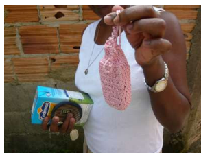
Figura 6.18: Capa para celular em crochê feita por D. Tônia

ou estampados com as marcas dos fabricantes ou das operadoras. Afonso, aos 31 anos, mantém esse estilo jovem de apresentação do celular (Figura 6.16). Com isso alcança não apenas o objetivo instrumental de não perder tempo procurando o celular quando este toca, mas também um objetivo simbólico de construir para si uma noção de pessoa ligada às novidades tecnológicas, e de uma pessoa que trabalha. Seu celular, como vimos nos capítulos anteriores, é um smartphone da Nokia da nova geração 3G do qual Afonso não pode usar todas as funções plenamente devido ao preço dos pacotes de tarifa para esses novos serviços, como a videochamada. Usar o celular dessa maneira também é freqüente entre os adolescentes – um estilo masculino jovem que também faz parte da estética, por exemplo, dos jovens que circulam pelo morro trabalhando como olheiros para o tráfico.