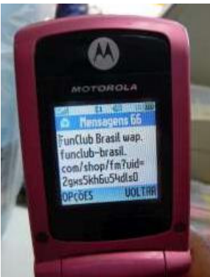
Figura 5.2: Tela do celular de Naiara mostrando a 66ª mensagem de texto recebida

Naiara, uma professora de trinta e dois anos, mora em outro bairro mas vai ao São Jorge duas vezes por semana para dar aulas no grupo de alfabetização de adultos. Assinou um serviço de piadas via SMS sem prestar atenção nas tarifas e agora não consegue cancelá-lo. (Figura 5.2) Como resultado, não coloca mais recarga depois que o serviço consumiu vinte reais de crédito em um mês: “Meu celular já era pai-de-santo, agora mesmo é que ficou mais”.