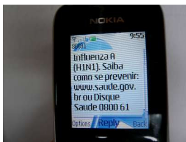
Figura 1.2 Torpedo enviado pela operadora Vivo informa sobre a gripe A

Em um registro sociológico, o estudo de Sorj (2003) sobre a desigualdade na chamada “Sociedade da Informação” foi um dos poucos trabalhos que encontramos a tratar da questão dos telefones celulares nessa temática, destacando-se por pensar a questão no bojo da rápida disseminação dos celulares entre as camadas populares, ocorrida no Brasil nos primeiros anos do século XXI. Contra argumentos que sugeriam que as camadas populares, no final dos anos noventa, estavam sendo induzidas pela publicidade a comprar um produto “desnecessário” (os celulares pré-pagos), cujas tarifas eram bem mais altas que a telefonia fixa, Sorj lembra que as camadas populares não são tão