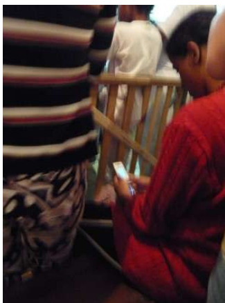
Figura 8.6: Celular sendo usado na assistência durante uma gira

Um primeiro caso etnográfico a ser considerado é a da própria