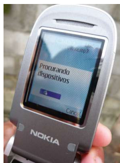
Figura 4.8: Celular com bluetooth transmitindo um arquivo de música

No São Jorge, o bluetooth é fundamental na obtenção de conteúdos para os telefones celulares, sejam estes arquivos de vídeo, imagens, ou músicas 71 . No caso dessas últimas, há aqueles que preferem deixar o