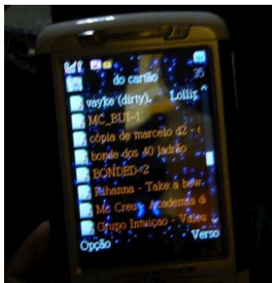
Figura 7.5: Celular de um adolescente do São Jorge, com música rap e funk

Foi assim, observando, entrevistando e trocando arquivos via bluetooth, que pude comprovar a preferência dos jovens do S. Jorge pelos estilos de música rap e funk. (Figura 7.5) No caso do funk, uma