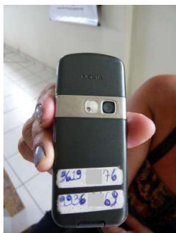
Figura 4.5: Celular com o número do aparelho em destaque no verso

adesivo com o número escrito, como é o caso de Mércia (Figura 4.5). Muitos, como Mércia, não conseguem navegar nos menus do celular até encontrar o local exato onde está registrado o número do chip em uso no aparelho. Outro caso etnográfico bastante significativo é o dos analfabetos – comecei a interessar-me pelo tema através dos