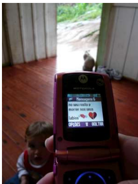
Figura 4.6: Celular da adolescente Clara com poesias de amor

Por fim, embora a maioria das mensagens recebidas origine-se das operadoras – sejam mensagens de serviço ou oferta de produtos – é significativo apontar a inserção do SMS em rotinas cotidianas que são importantes para os moradores do São Jorge. As lojas, por exemplo. Já vimos no início do capítulo que é importante ter um número de celular para “preencher uma ficha” e, assim, obter crédito. O relacionamento dos moradores com as lojas é intenso, já que todos os meses as visitam para pagar as prestações. (Aliás, nesse ponto até a humilde função calculadora do celular foi lembrada por vários interlocutores: “é ótimo, pra gente calcular todo mês quanto vai pagar pras lojas...”) Mas passa a ser útil também saber ver as