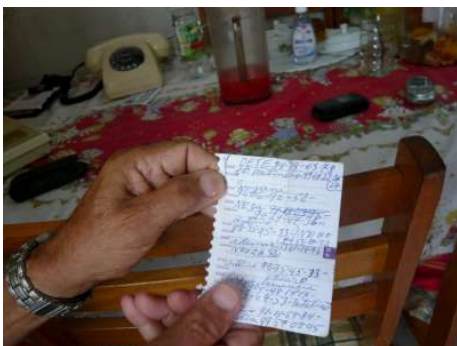
Figura 4.7: Seu Ciro: agenda de papel para quem não sabe usar a do celular

números. A falta de backup, aliás, é desesperadora quando se perde um celular com todos os contatos: “lá tem todos os números que a gente precisa, da família, dos médicos, dos advogados, tudo” diz Nique. Para Nena, o celular é uma fonte de renda. Agora, em vez de “namoradinhos”, ela usa o termo “clientes” – Nena atua como trabalhadora do sexo para complementar sua renda: “Aqui tem todos os