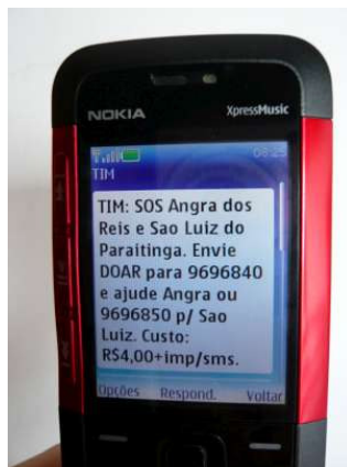
Figura 1.3 “Torpedo social” angaria fundos para as vítimas das chuvas de janeiro de 2010 nos Estados de São Paulo e Rio de Janeiro.

Em São Paulo, entre janeiro e março de 2009, mais de dois milhões de paulistanos receberam um torpedo educativo contra a dengue, cuja mensagem dizia: “evite água parada em pneus, garrafas e vasos”. A mesma estratégia foi utilizada para incentivar doações de sangue no maior hemocentro do capital paulista; e em 2008, o envio de mais de três milhões de “torpedos sociais” contribuiu para a arrecadação de fundos para a Defesa Civil de Santa Catarina durante a tragédia das chuvas e desabamentos de novembro daquele ano. Já o operadora Oi, através do instituto Oi Futuro, patrocina um projeto que também opera com foco no envio de mensagens de texto: é o “Alô Cidadão”, que funciona na cidade de Belo Horizonte 16 (PROJETO DE INCLUSÃO...).