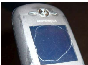
Figura 6.22: Celular vítima da raiva de Paulina

Em outra ocasião, encontro novamente Paulina, e comentamos a