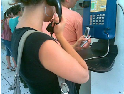
Figura 5.4: Celular-orelhão , o híbrido brasileiro