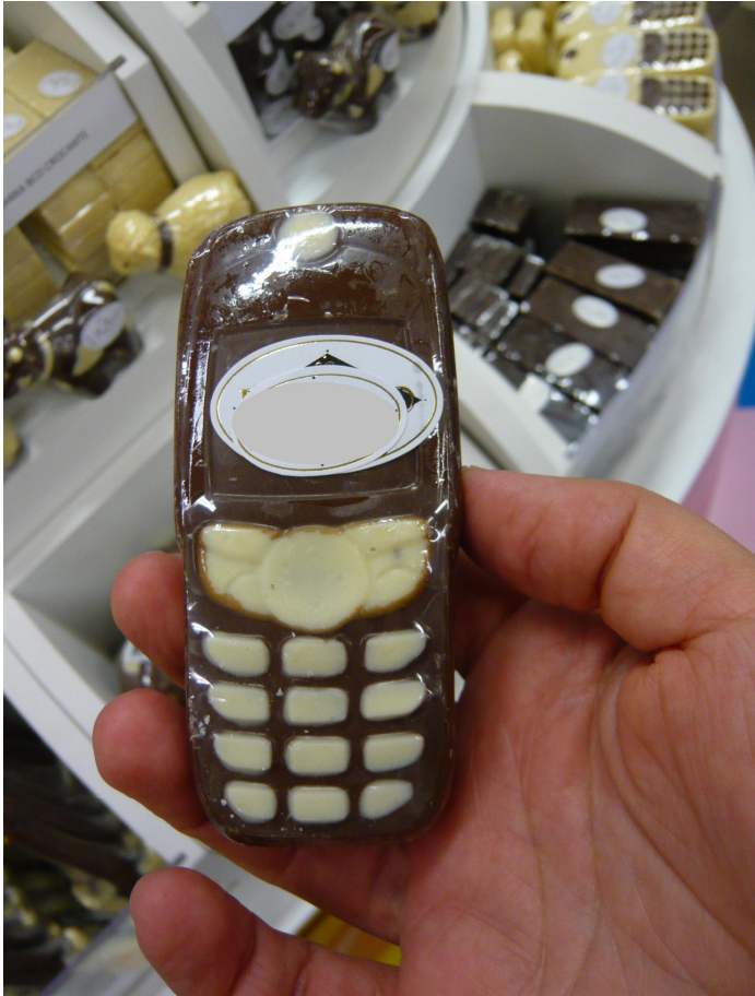
Figura 2.1 Celular de chocolate à venda em loja de produtos artesanais em Florianópolis. O que essa imagem pode nos dizer a respeito das relações das pessoas com seus telefones celulares?