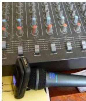
Figura 8.3: Celular ajuda a celebrar o culto da Assembléia de Deus no São Jorge