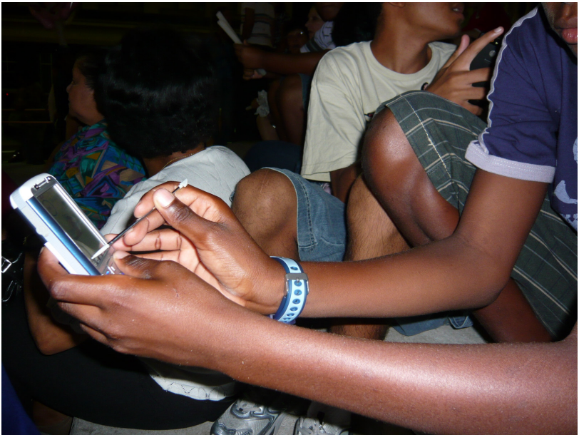
Figura 4.2 No São Jorge, amigos se entretêm com um celular chinês de tela sensível ao toque.