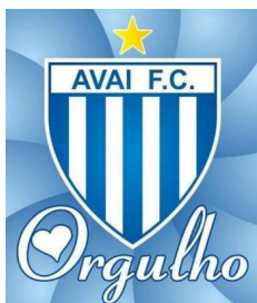
Figura 6.23: Torcida pelo Avaí Futebol Clube vai para os celulares do São Jorge