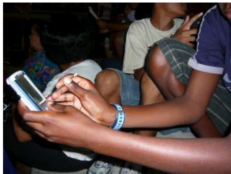
Figura 4.2: Amigos se entretém com um celular chinês de tela sensível ao toque

Durante o trabalho de campo, sempre que perguntava como alguém usava as diferentes funções do celular, a resposta na grande