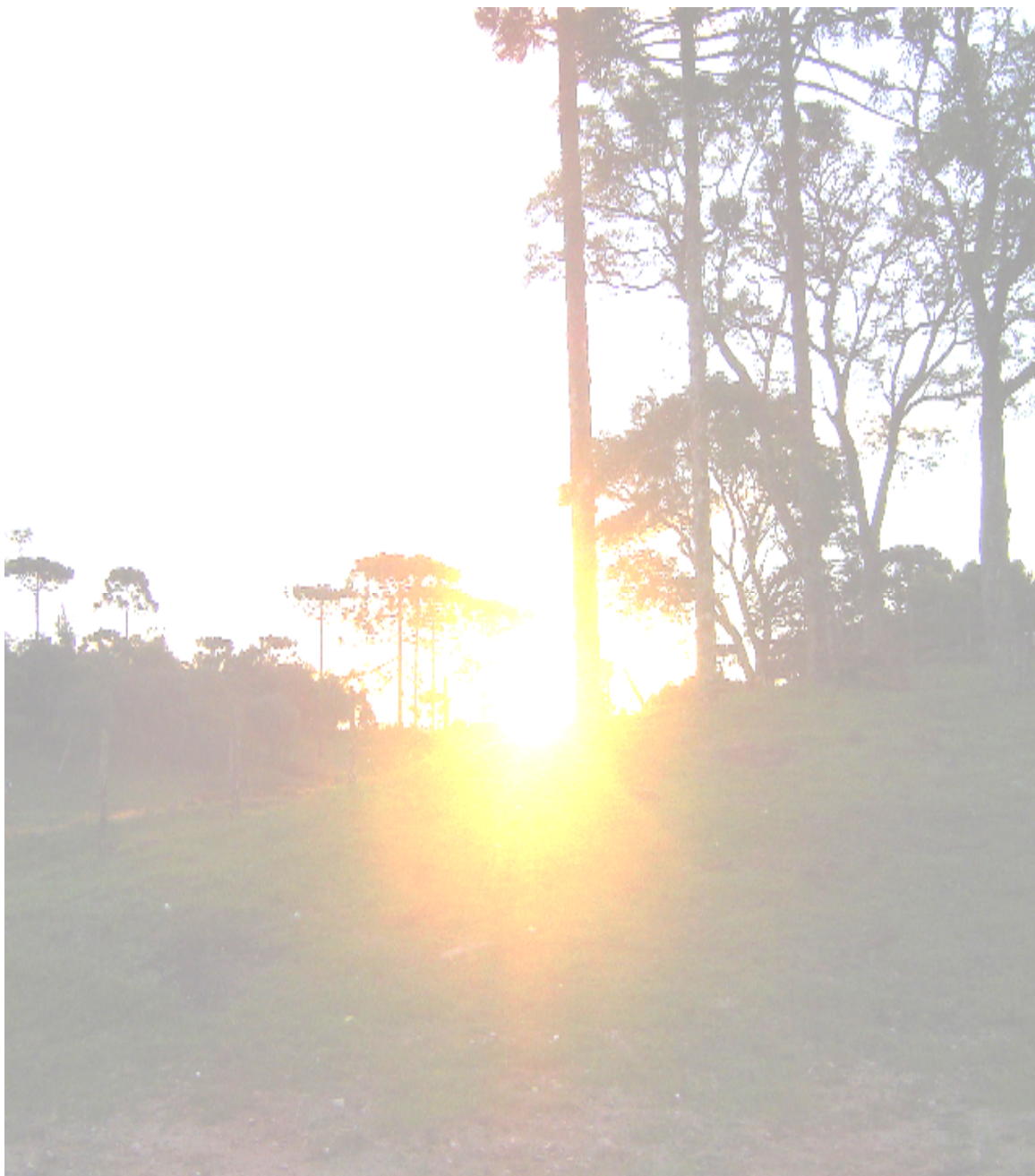
Calmon – Raquel Puhl (23/06/07)

Um povo de homens educados será sempre um povo de homens livres. (José Martí)