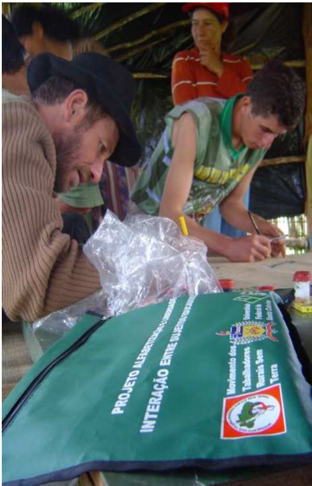
Figura 1: Acampamento Índio Galdino II, situado no município de Curitibaanos