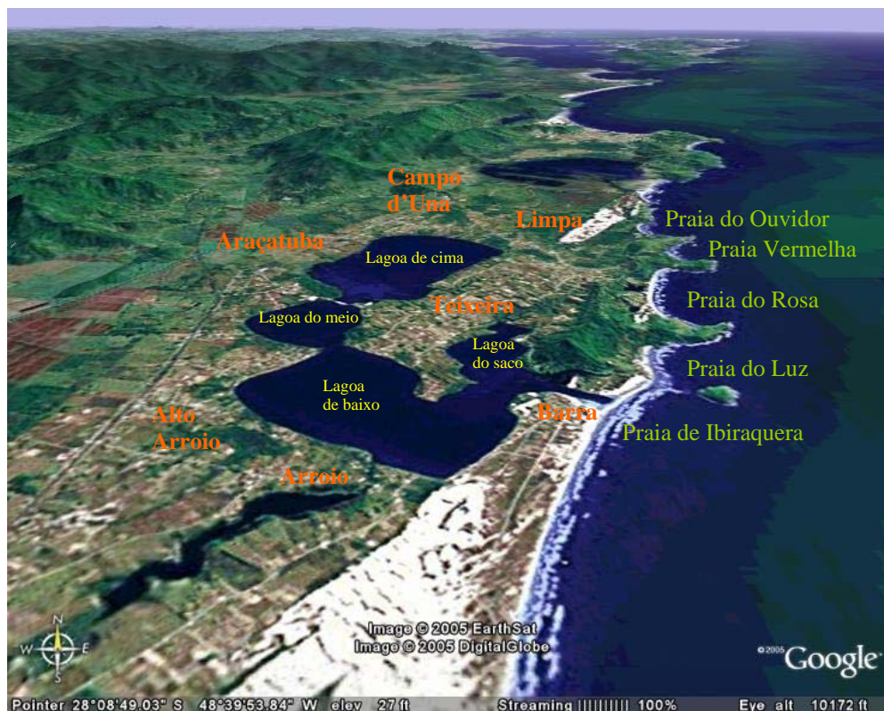
Figura 3 - Vista geral da Lagoa de Ibiraquera.