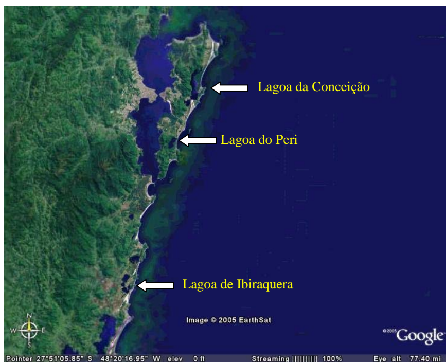
Figura 2 - Localização da Lagoa de Ibiraquera em relação a Florianópolis, e sua dimensão comparada a Lagoa do Peri e Lagoa da Conceição.

A Lagoa apresenta um contato com o mar através de um canal que tem sua abertura controlada pela ação antrópica e é composta por quatro bacias: Lagoa de Cima , Lagoa do Meio , Lagoa de Baixo e Lagoa do Saco .