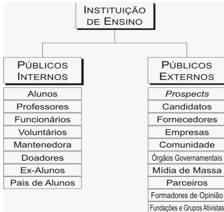
Figura 1: Públicos de uma Instituição de Ensino