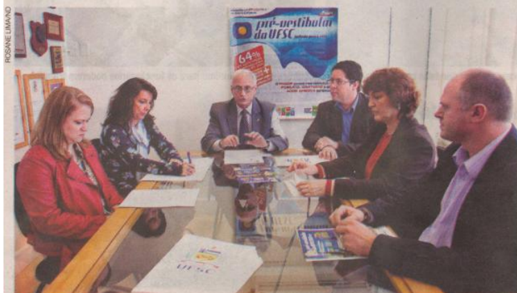
Cronograma. Representantes da UFSC e governo do Estado apresentaram o edital de inscrições do cursinho

públicas catarinenses – no total são 90 mil jovens –, o secretário de Estado da Educação, Eduardo Deschamps, enviou ao Capes (Coordenação de Aperfeiçoamento de Pessoal de Nível Superior) proposta para ampliação do projeto e aguarda resposta. Rosa também salientou que o número de cidades será maior no próximo ano.