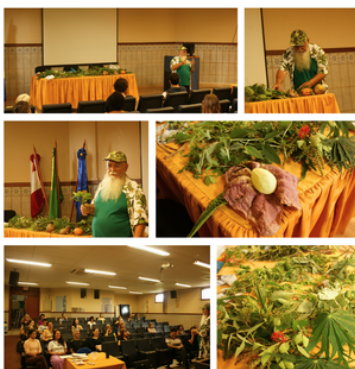
Oficina de Plantas Medicinais e PANCs