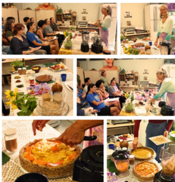
Oficina de Alimentação Viva