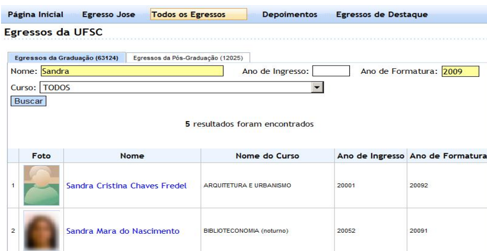
Figura 3: Consultas aos egressos da instituição.

Na tela de consulta geral, mostrada na Figura 3 , o egresso tem a possibilidade de visualizar qualquer graduado da instituição, através de especificações de parâmetros de consulta, permitindo assim a interação com todos os egressos da instituição cadastrados nos Sistemas Acadêmicos.