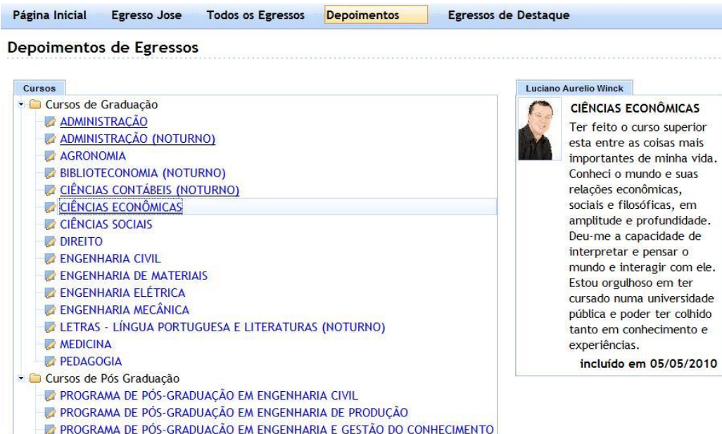
Figura 5: Publicação dos depoimentos dos egressos.

Os depoimentos são publicados como mostrado na Figura 5 . Assim, a administração universitária e a sociedade podem conhecer a visão de seus egressos sobre o curso e a gestão universitária, podendo servir de subsídios para escolha de cursos pelos candidatos ao vestibular.