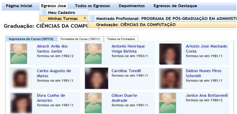
Figura 2: Consultas aos egressos da turma ou do curso.

Na tela de consulta geral, mostrada na Figura 3 , o egresso tem a possibilidade de visualizar qualquer graduado da instituição, através de especificações de parâmetros de consulta, permitindo assim a interação com todos os egressos da instituição cadastrados nos Sistemas Acadêmicos.