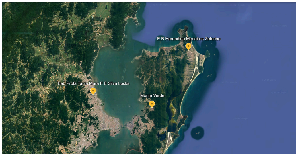
Figura 2 - Deslocamento do entrevistado (O., 45 anos)