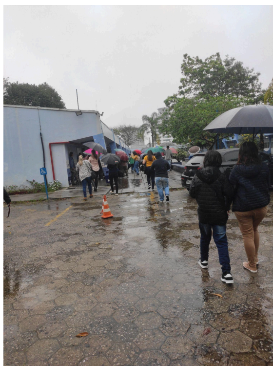
Formação de filas no dia do Processo Seletivo (28/10/23)