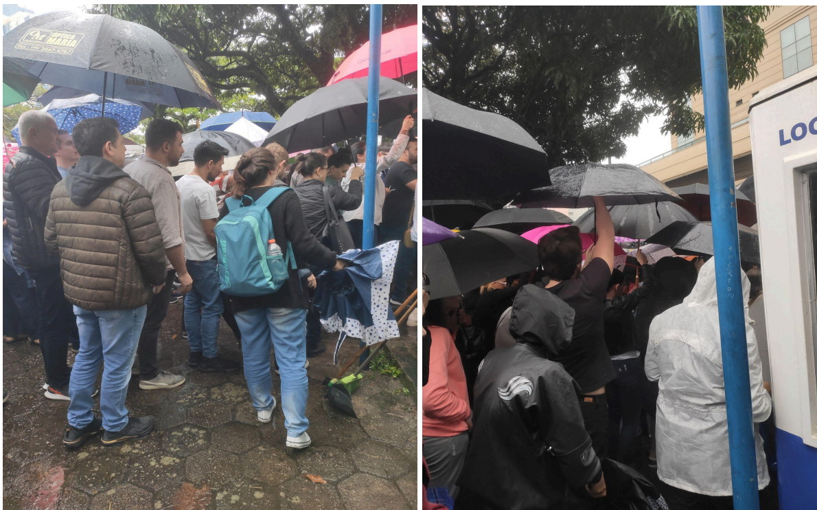
A saída do Processo Seletivo (28/10/23)

Por alguns minutos, consegui concentrar-me na conversa de um grupo de professores que estava ao meu lado. Eles expressavam frustração em relação aos erros de digitação presentes em vários enunciados das questões da prova — algo que eu mesmo observei. Além disso, queixavam-se da impossibilidade de destacar o gabarito com suas respostas para levar consigo, o que, segundo eles, poderia complicar o processo de recurso. Mais tarde, descobri que a foto do cartão-resposta preenchido e o documento digitalizado dos enunciados de cada prova seriam disponibilizados no site da banca organizadora do certame, visando garantir o acesso aos recursos dos candidatos.