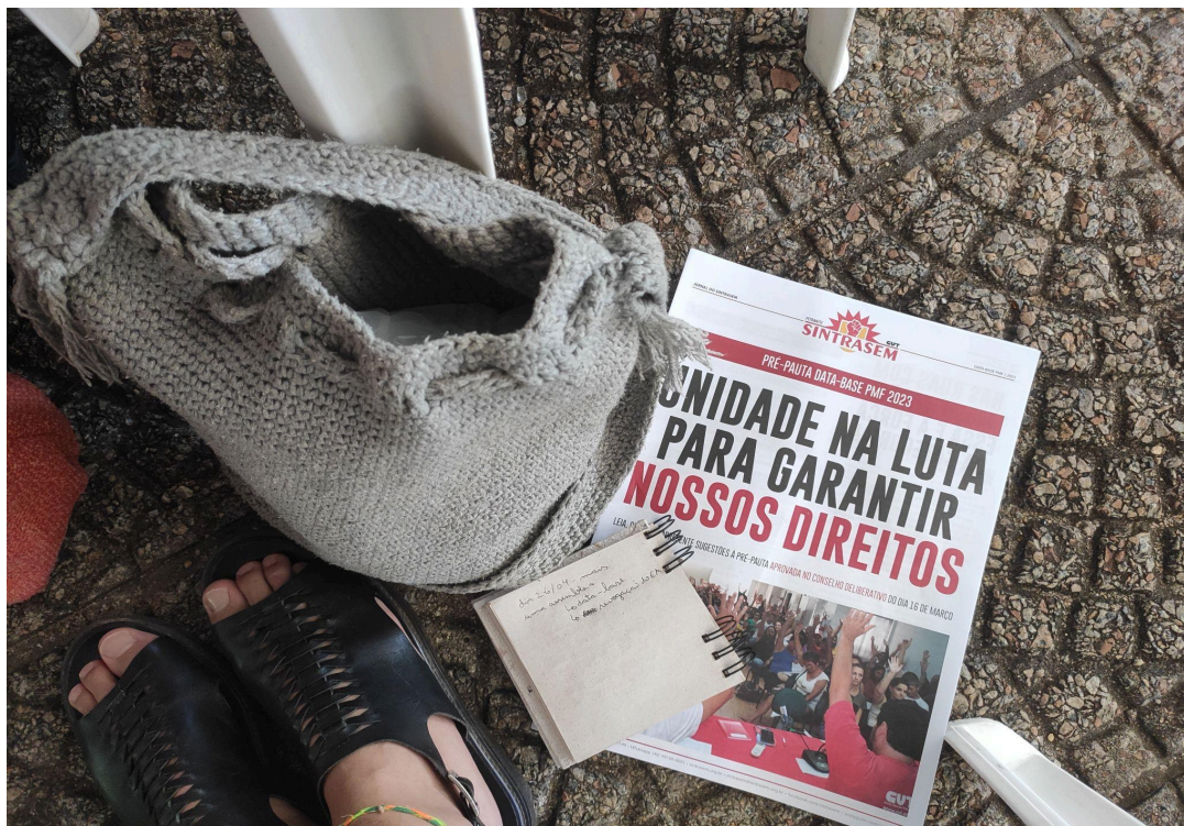
Caderno de campo e o Jornal do SintraseM onde as pautas do movimento estavam organizadas para facilitar o debate nas assembleias (30/05/23)

adversário no jogo político. Isso evidencia como as dinâmicas desse jogo ocorrem através de uma cartografia, na qual as informações são capitalizadas e deslocadas por circuitos que permitem a elaboração de estratégias.