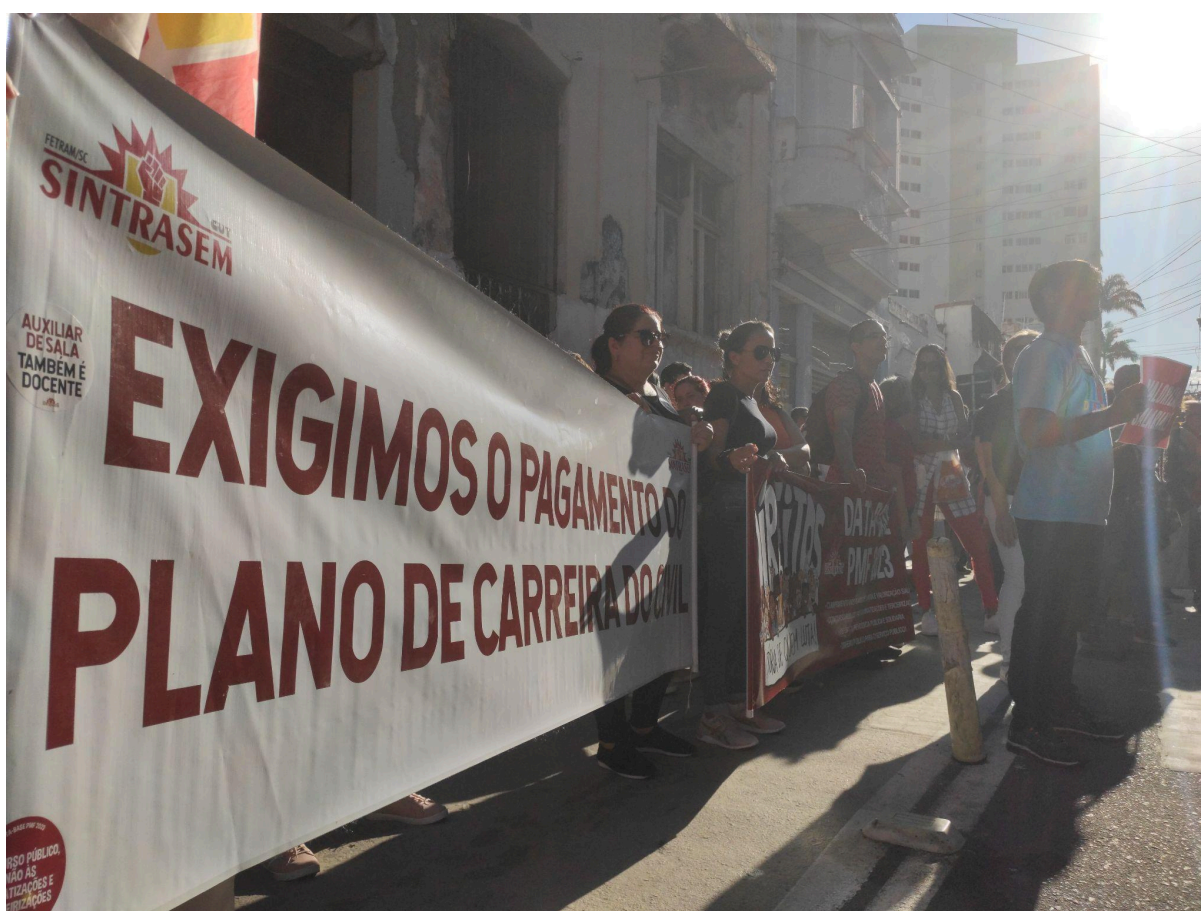
Acervo do autor - Ato promovido pelo SintraseM, em frente à Prefeitura de Florianópolis (30/05/23)

fora o cerne das manifestações anteriores. A incorporação das OSs em todas as Secretarias Municipais poderia instaurar uma cultura de gestão dos serviços públicos de Florianópolis baseada nas práticas de gerencialismo provenientes do mundo corporativo e dos negócios (Ho, 2009). Nessa perspectiva, serviços essenciais para a população deixariam de ser encarados como direitos a serem preservados e expandidos, passando a ser tratados como commodities sujeitas a cortes e austeridade financeira. Isso representaria uma inversão nas prioridades em relação aos princípios fundamentais que o próprio movimento grevista considera apropriados: a destinação de recursos públicos para o serviço público, uma gestão pública técnica que respeite os processos internos e a valorização profissional dos servidores.