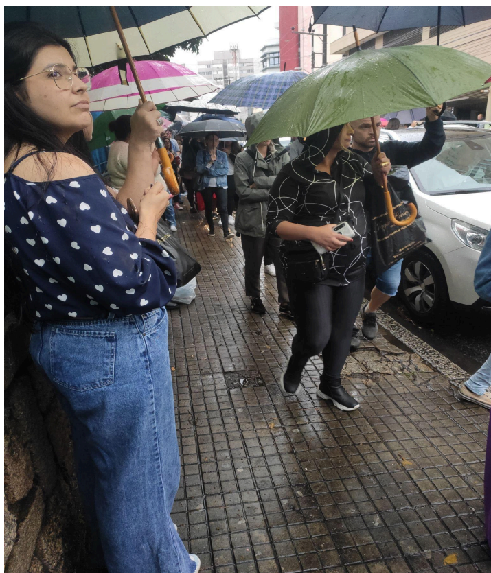
A entrada do Processo Seletivo (28/10/2023)

professores, os quais aproveitavam aquele momento para dar uma última conferida em seus celulares.