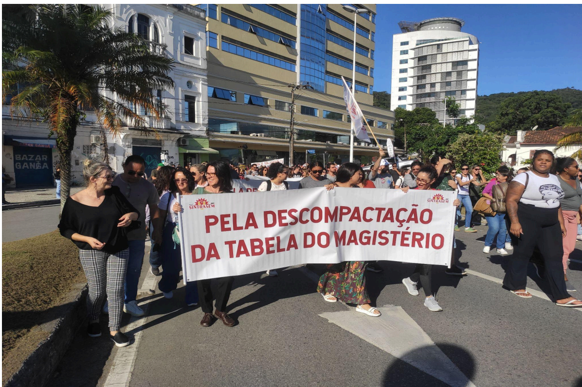
Professoras pedem a descompactação na tabela de remuneração durante a caminhada do ato (30/05/23)