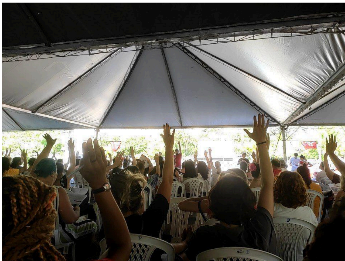
Momento de deflagração da greve dos servidores públicos de Florianópolis (30/05/2023)

assembleia em 30 de maio de 2023, ao se depararem com a proposta da prefeitura de conceder os direitos de gestão das Secretarias Municipais às chamadas Organizações Sociais (OSs) - entidades privadas com personalidade jurídica que recebem recursos públicos para administrar determinadas instituições do serviço público - os trabalhadores encontrassem o catalisador para a deflagração da greve dos servidores municipais de Florianópolis. A Secretaria Municipal de Administração planejava a implementação do que chamou de sistema híbrido de gestão, no qual os cargos administrativos, incluindo os de chefia, passariam a ser compostos em parte pela atuação do interesse privado, sem uma contrapartida acerca de novos concursos públicos para provimento de vagas dos servidores efetivos que estariam para se aposentar.