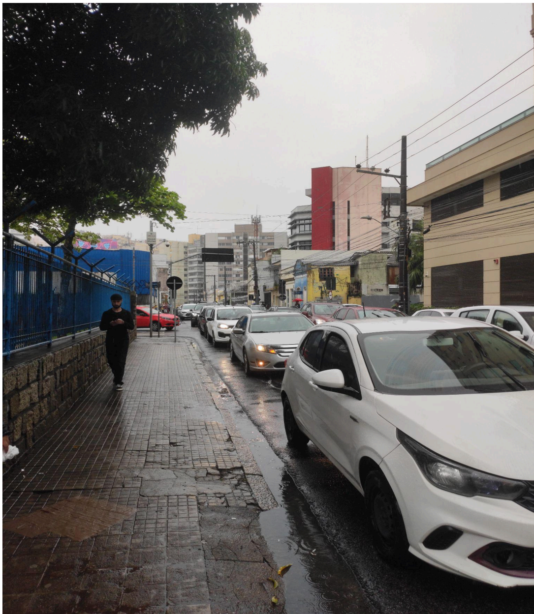
A fila na vida pública (28/10/2023)

Expliquei que almejava uma vaga como professor de Sociologia no Ensino Médio. Se fosse bem-sucedido, essa seria minha primeira experiência plena na regência de turmas, diferentemente do estágio obrigatório durante a licenciatura, no qual a regência ocorre com limitações de tempo e com conteúdos e práticas pedagógicas estritamente delineados pelos supervisores das atividades, os professores titulares das turmas.