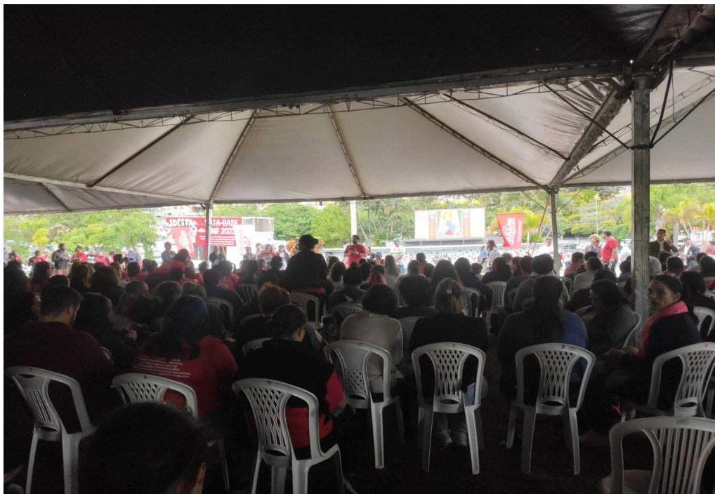
Assembleia do Sintrasem (30/05/2023)

Por um lado, observamos o Poder Executivo mostrando por meio de suas táticas de comunicação que “silêncios e respostas parciais são muito eloquentes”, como bem lembrou um dos dirigentes da mesa ao descrever esse cenário de enrolação que os agentes públicos produziam para ganhar tempo e poder planejar suas estratégias políticas. Por outro lado, os representantes do movimento sindical brandiam a fúria, aguardando gestos e sinais sonoros de validação por parte de seus companheiros de luta, diante do que consideravam um ato de aparente menosprezo.