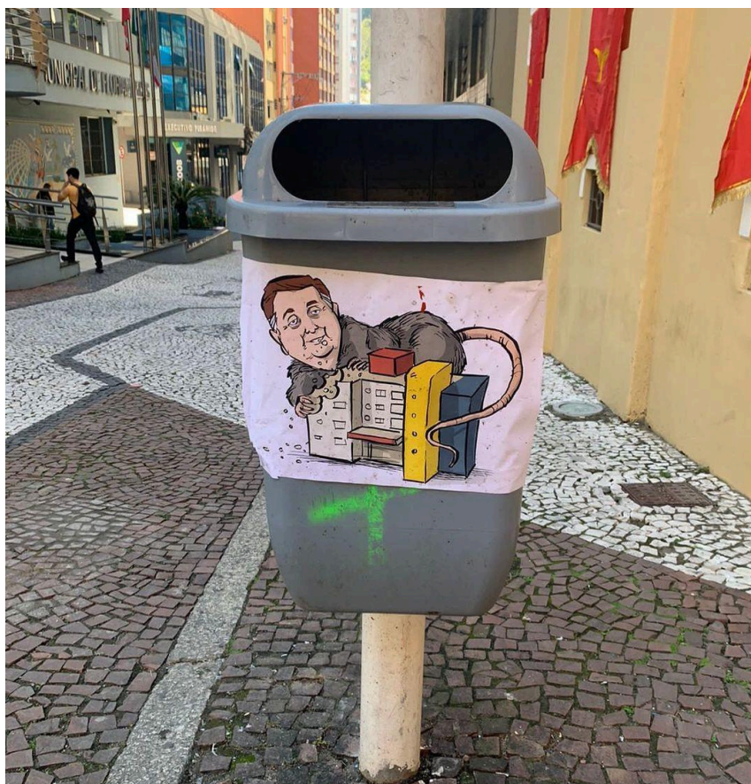
Imagens de Topázio Neto com corpo de rato se alimentando do prédio da Prefeitura são colocadas em lixeiras pelo centro da cidade.

A fim de encerrar o movimento grevista e atender às demandas da população de Florianópolis pelo retorno das atividades nos setores públicos, o Poder Executivo cedeu às exigências dos trabalhadores. No entanto, a resposta não foi rápida o bastante para evitar interpretações populares sobre a natureza vilanesca da postura política do Prefeito, que passou a ser narrada em diversos espaços da cidade.