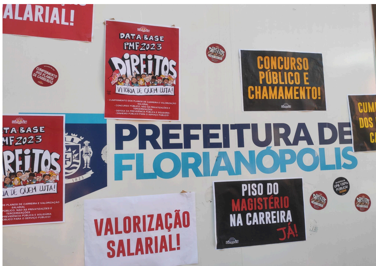
Fachada da Prefeitura Municipal de Florianópolis após a dispersão dos manifestantes (30/05/23)