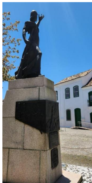
FIGURAS 5 e 6 – Monumento a Anita Garibaldi Laguna/SC

A desconstrução da representação secundária de Anita Garibaldi na história é fundamental para resgatar sua importância real e reconhecer suas conquistas individuais. Ela não era apenas uma figura coadjuvante na história, mas uma heroína por mérito próprio, cuja autoridade e determinação deveriam ser lembradas e celebradas. Além disso, a análise crítica dessa representação ajuda a promover uma compreensão mais equitativa do papel das mulheres na história e na sociedade, contribuindo para a luta pela igualdade de gênero.