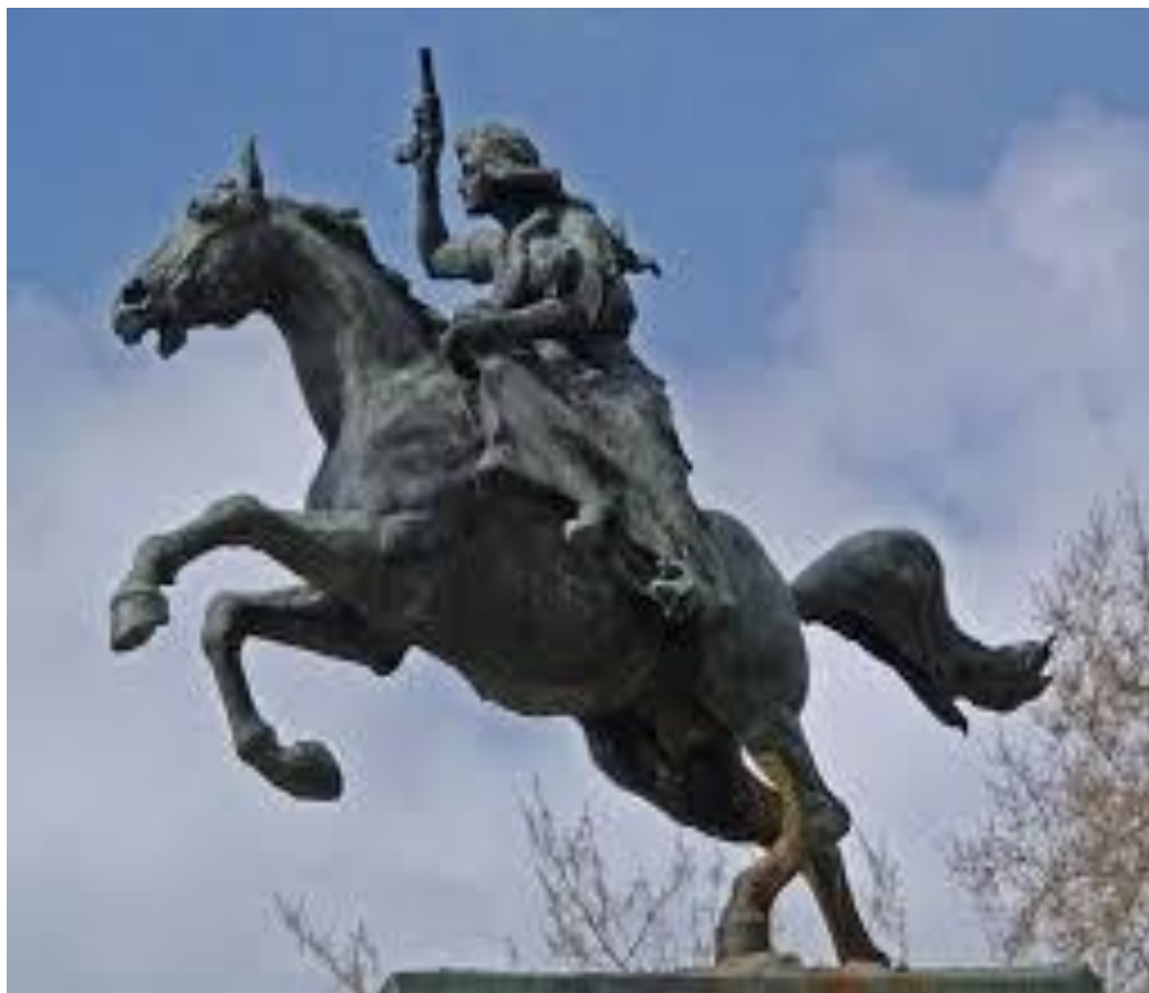
FIGURA 7 – Monumento a Anita – Roma.

Disponível em: https://www.tripadvisor.com.br/Attraction_Review-g187791-d7622499-Reviews-Monumento_ad_Anita_Garibaldi-Rome_Lazio.html