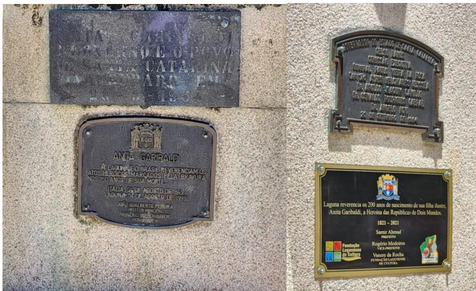
FIGURAS 1 e 2 – Placas de identificação presentes no monumento a Anita Laguna/SC

da República de Dois mundos. (1821 a 2021).” Assinada por Samir Ahmad prefeito da época e pela Fundação Laguneira de Cultura. A placa menor destaca apenas o nome do governador Celso Ramos e da Comissão Executiva do governo em vinte de setembro de 1984.