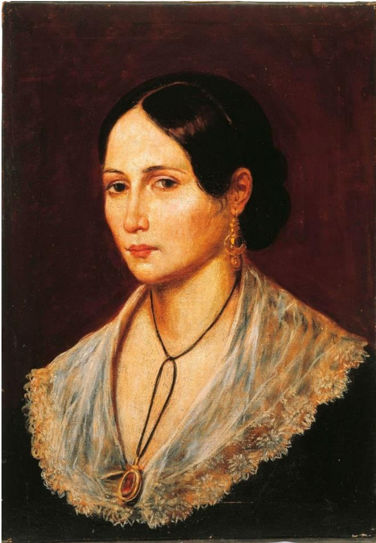
FIGURA 8 – O famoso retrato. Ritratto di Anita Garibaldi – Gaetano Gallino.

Neste retrato ela parece uma dama... com joia, rendas, e um olhar preocupado e sério.