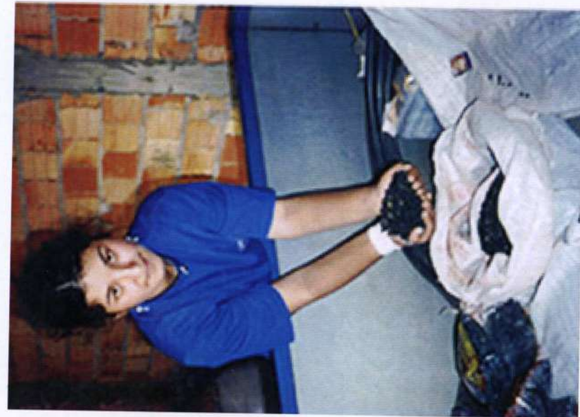
São José do Cerrito