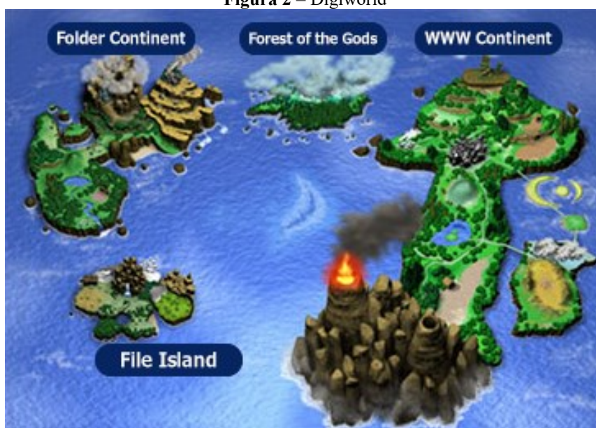
Figura 2 – Digiworld

Um dia, um vírus com inteligência artificial começou a se espalhar entre os computadores do mundo. Ele mudou de forma e formato enquanto viajava pela rede e evoluiu para as formas de vida conhecidas como Monstros digitais ou Digimon! (Bandai, 2023, tradução nossa).