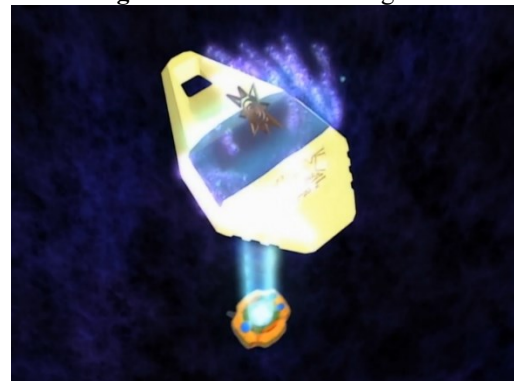
Figura 8 – Brasão da Coragem.