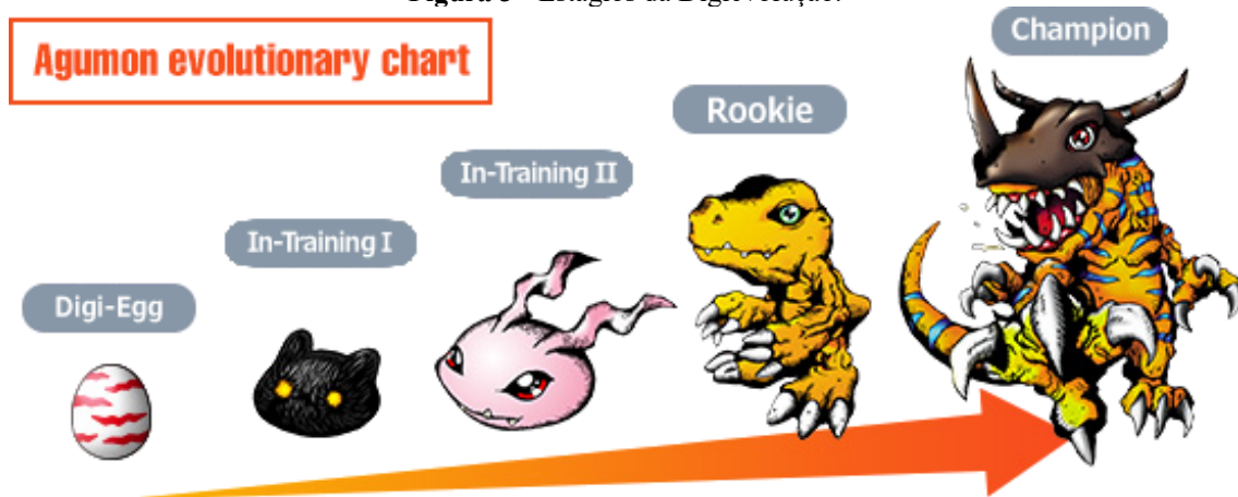
Figura 3 - Estágios da Digievolução.

Digimons crescem quando consomem programas ou dados, vencendo batalhas ou se alimentando, que permitem digievoluir (Digimon, 1999).