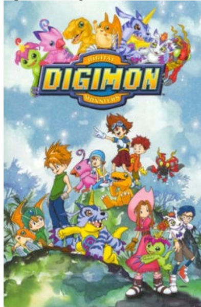
Figura 1 – Digimon Adventure 1999.

Fonte: Pôster de divulgação de Digimon Adventure 4