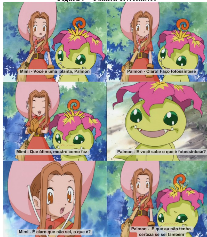
Figura 9 – Palmon-fotossíntese

O Digiworld é ambientado na internet humana, tendo muitas características e conceitos em comum com mundo real, porém não necessariamente aplicadas da mesma forma, como podemos ver na figura 9 o diálogo de Mimi e Palmon que demonstra esse choque de informação.