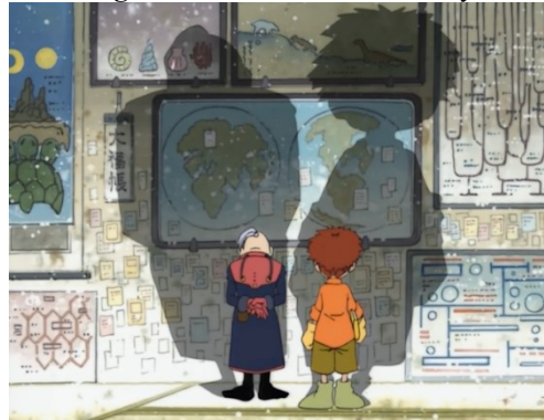
Figura 6 – Mestre Gennai e izzy