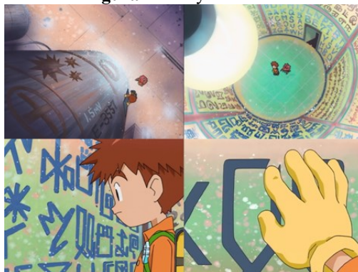
Figura 4 – Izzy na bateria

No episódio 5 (Kabuterimon, 1999), as crianças encontram uma fábrica em pleno funcionamento, Izzy explorando a área encontra uma grande bateria com códigos computacionais escritos nas paredes, ao interagir interfere no funcionamento da fábrica (figura 4) chegando a dedução: “[...] baterias produzem eletricidade através do metal e do líquido que tem dentro, mas é diferente, o programa na parede está produzindo eletricidade”, deduzindo que “nesta fábrica o próprio programa produz sua própria energia. Neste mundo, informações substanciais como dados ou programas são descartadas e inevitavelmente...” (Kabuterimon, 1999), sendo interrompido por uma cena de batalha.