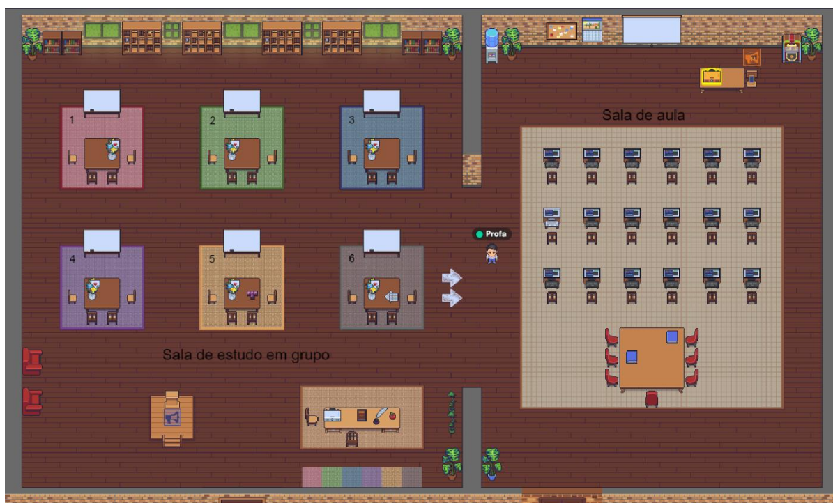
Figura 1: Ambiente interativo criado pelos professores com cenário de ambiente de estudos para as aulas.

Todo o conteúdo foi ministrado utilizando-se também da gamificação, de forma a caracterizar bem o aspecto metodológico ativo das ferramentas didáticas, praticamente em todas as atividades. Todas as aulas instrucionais foram no ambiente Gather© [23] (Figura 1), uma plataforma que permite o encontro de pessoas num ambiente virtual. Sendo assim, nesse espaço virtual criado em um cenário especialmente caracterizado com uma sala de aula, incluindo mobiliário específico, foi possível realizar as aulas, as orientações e reuniões de grupo, as apresentações dos trabalhos e demais situações ocorridas na disciplina. Além deste ambiente virtual, foram utilizadas as ferramentas Mentimeter© [24], Kahoot© [25], vários sites de jogos de aprendizagem (Trivial Pursuit, Zombie Sales Apocalypse, iCivics, Nobelprize.org, Games for change etc.), plataformas de gamificação, vídeos do Youtube e outros jogos educativos diversos, em que os alunos puderam acessar o conteúdo, por computador e smartphones, de maneira completamente diversa da metodologia tradicional.