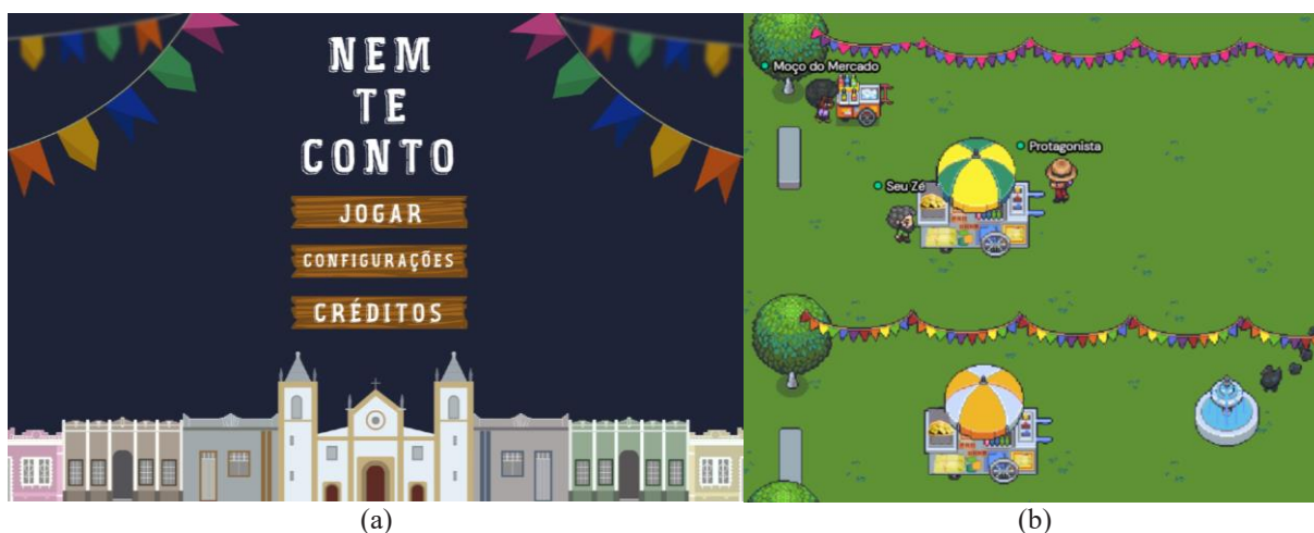
Figura 3: Partes do GDD do jogo “Nem te conto”: (a) Proposta da tela de apresentação do jogo, (b) Um dos cenários do jogo.

Para a segunda parte da disciplina, denominada de Ambientes Interativos, o trabalho 2 envolveu a conceituação de premissas da construção dos ambientes virtuais interativos com uso de ferramentas de modelagem e plataformas de construção de ambientes interativos. Assim, o segundo trabalho exigiu a construção de ambientes virtuais, em formato de jogo, para que fosse possível interagir nesse espaço virtual, arquitetonicamente elaborado, ao mesmo tempo em que se pudesse aprender algo a partir da visita a esse mesmo espaço. Os mesmos grupos da primeira etapa puderam criar seus próprios centros educacionais, de onde surgiram divertidos projetos: museus virtuais de temáticas diversas (museu da matemática, museu da história da arquitetura, museus dos jogos etc.), estações temáticas, centros de treinamentos (que ensinaram a dirigir), ambientes do tipo “ escape room ” com charadas onde, para se atingir o objetivo final, ou seja, escapar, o estudante deveria enviar as respostas corretas aos desafios propostos incorporados aos ambientes.