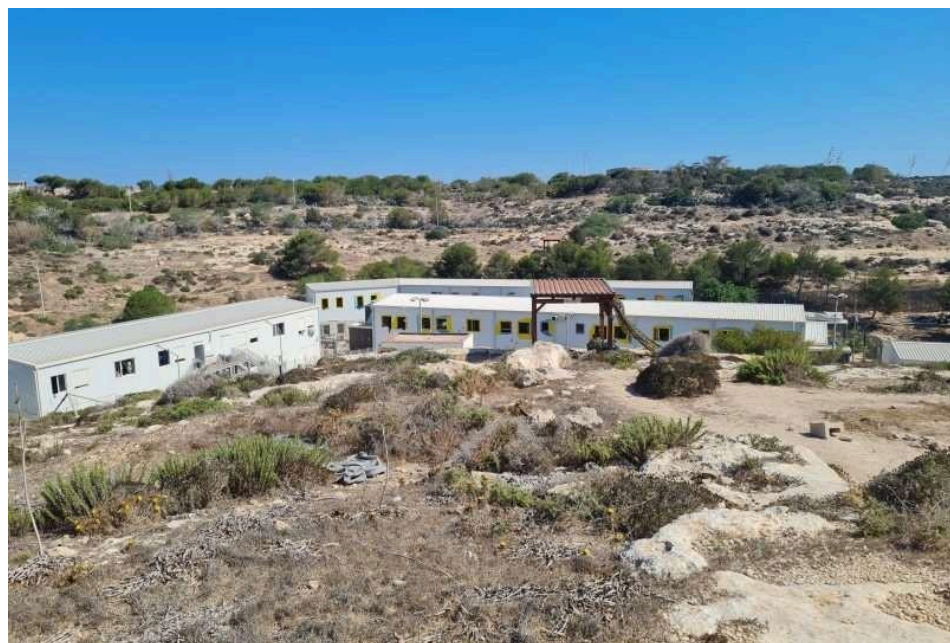
Figura 4. Imagens do Hotspot Lampedusa. Fonte: Gli Stati Generali (2022).

Apesar de Lampedusa ter um estatuto oficial com capacidade para 400 lugares (Dia, 2021), frequentemente acomoda um número muito maior de pessoas em necessidade, chegando a 8 vezes a capacidade do centro. Relatos