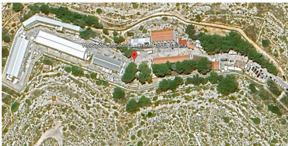
Figura 6. Hotspot Lampedusa vista de satélite.