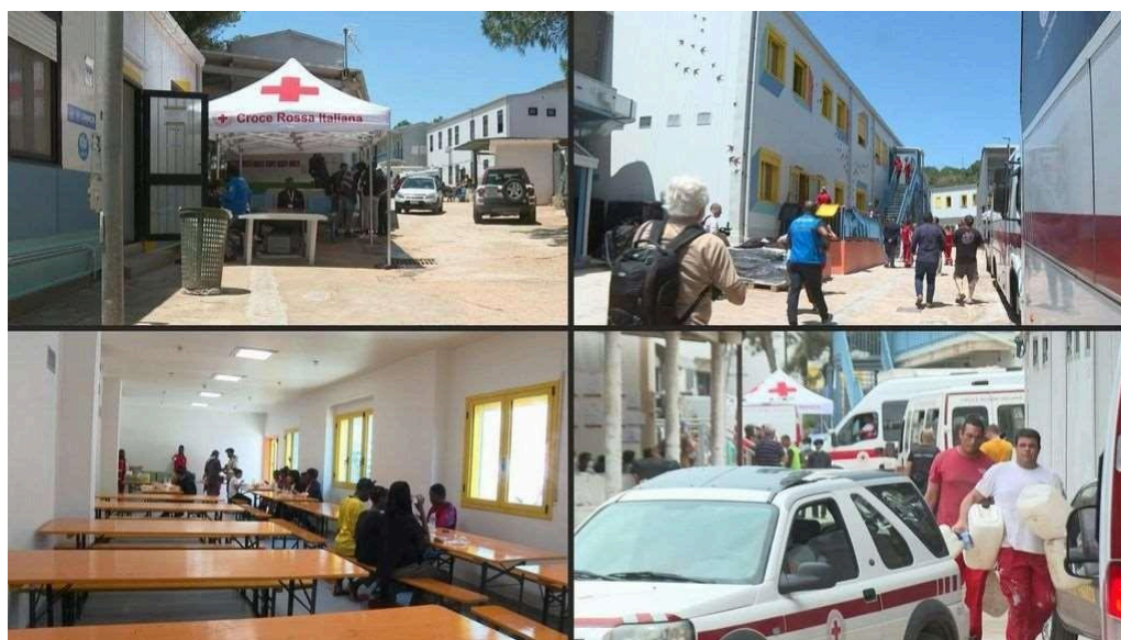
Figura 5. Algumas imagens internas do hotspot de jornais locais italianos.