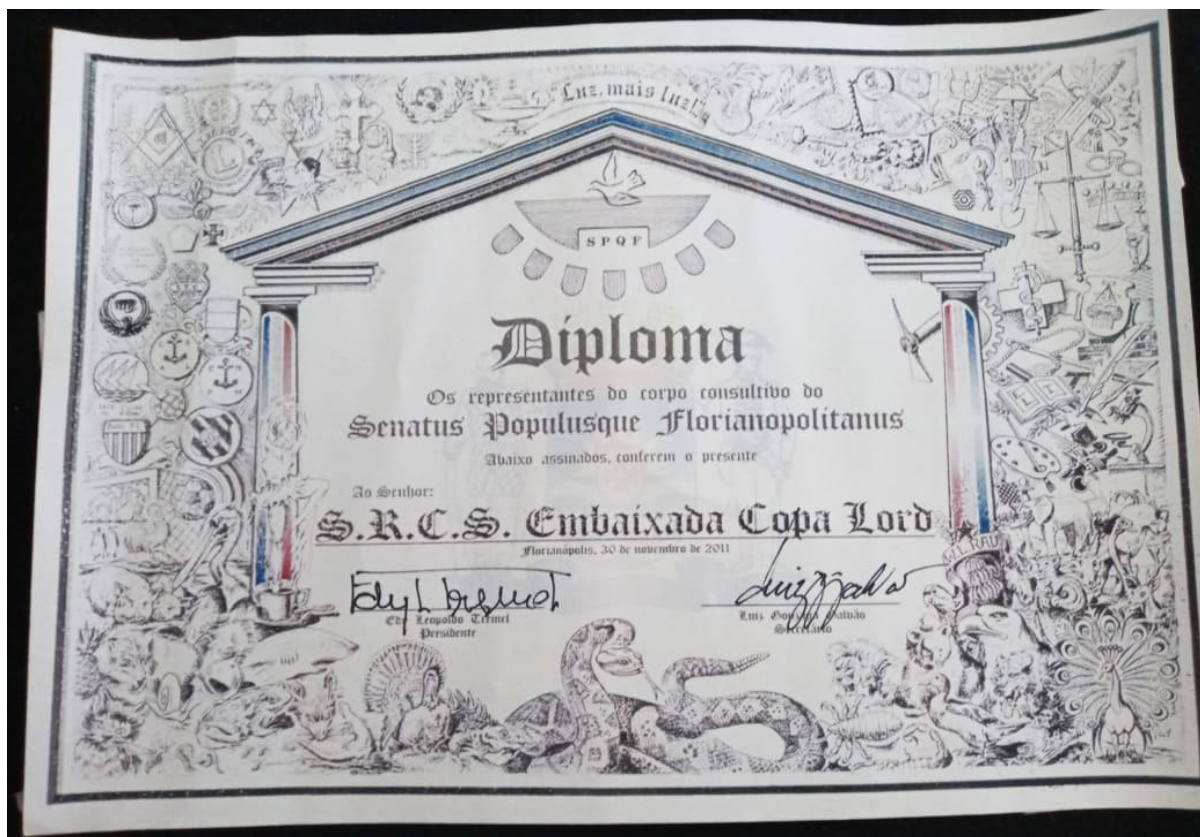
Figura 11: Diploma concedido à Copa Lord