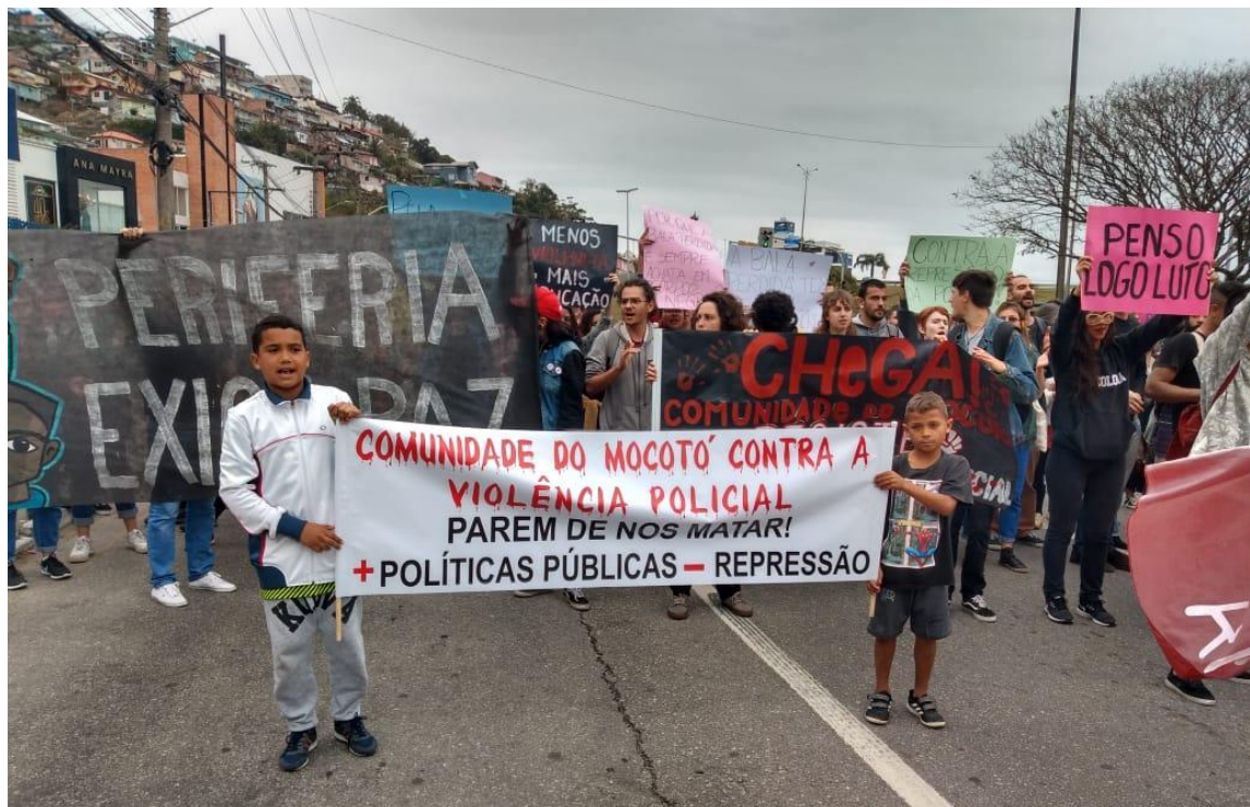
Figura 7: Manifestação contra violência policial em frente a entrada do Morro do Mocotó, na Avenida Mauro Ramos.