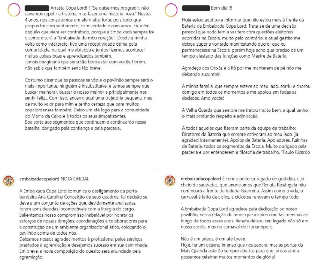
Figura 1: Notas de desligamento e notas oficiais da Embaixada Copa Lord.