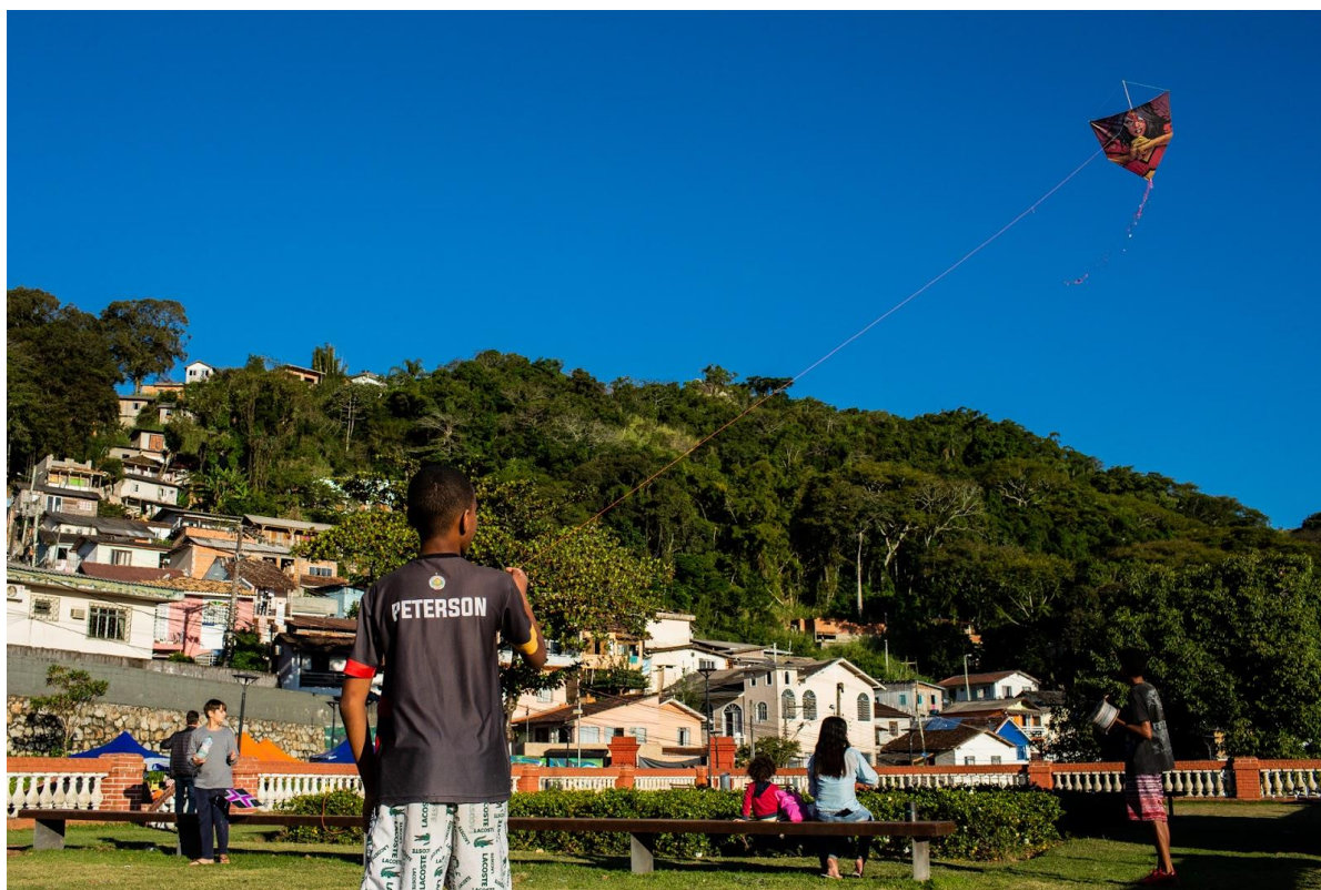
Figura 8: Criança soltando pipa em meio a Feira Amigos do Monte Serrat, em 2022.

23