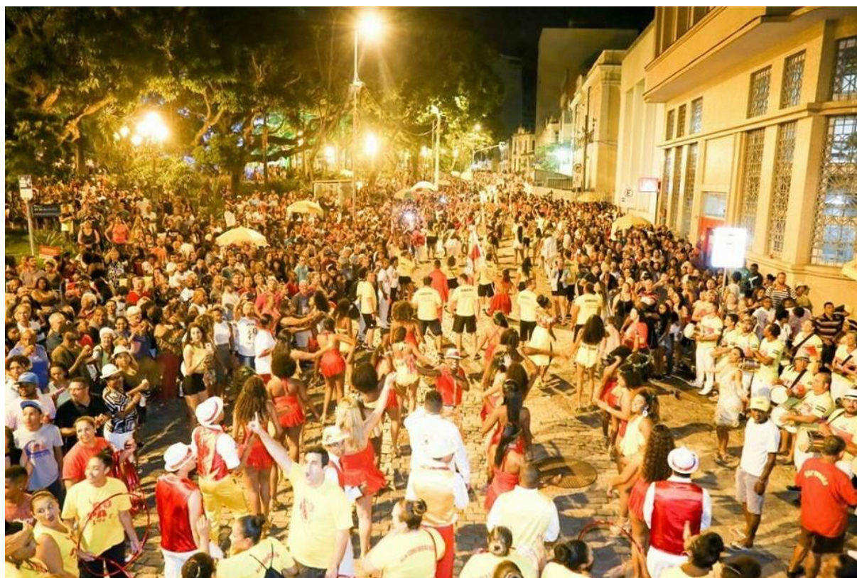
Figura 5: Volta à praça da Embaixada Copa Lord, em 2019.

Fonte: Divulgação / Liga das Escolas de Samba de Florianópolis (2019) 18