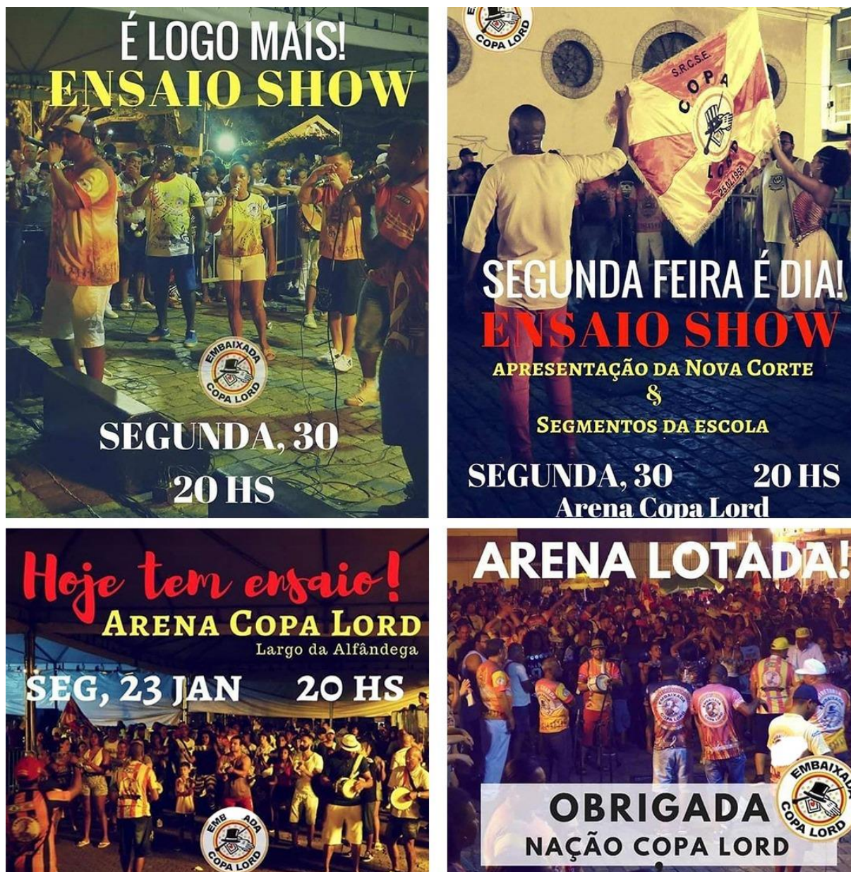
Figura 10: Divulgações no Instagram dos ensaios na Arena Copa Lord, em 2017.