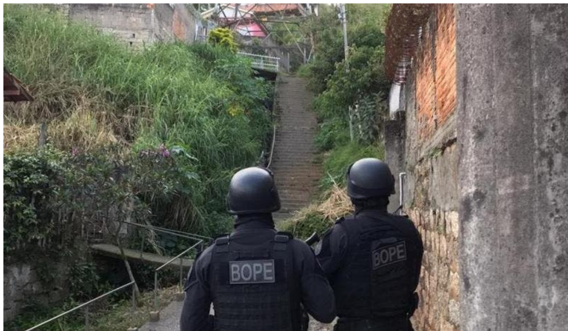
Figura 6: Operação policial de combate ao tráfico no Morro do Mocotó.