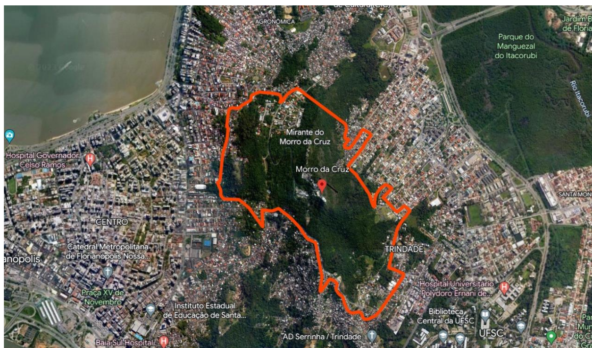
Figura 2: Visão superior do Maciço Morro da Cruz e região central de Florianópolis.

Fonte: Google Maps (2022). Marcação da autora.