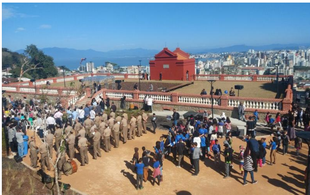
Figura 9: Inauguração da Praça do Monte Serrat com a presença da banda da Polícia Militar, em 2019.