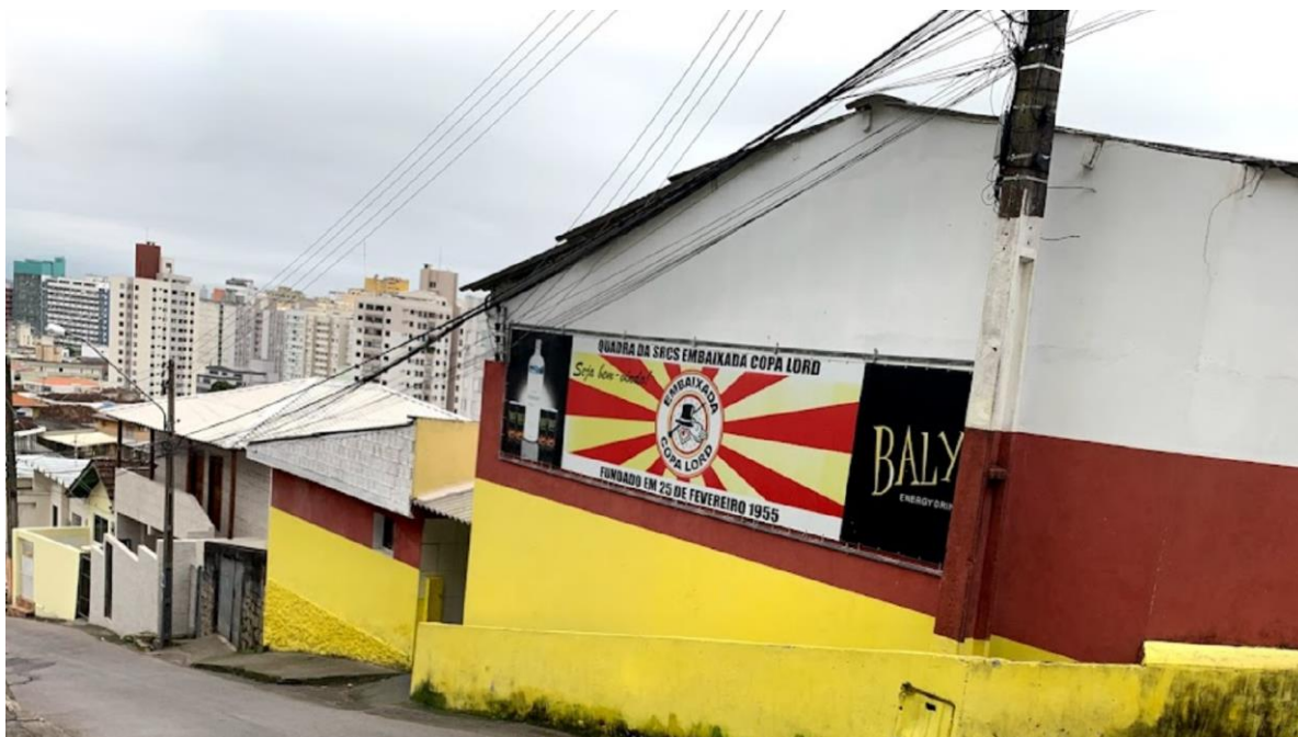
Figura 3: Quadra da Embaixada Copa Lord, no Morro da Caixa/Monte Serrat.

criação tanto da Embaixada Copa Lord quanto da Protegidos da Princesa, as duas principais escolas do cenário carnavalesco até hoje. Entretanto, como observa Marcelo Silva (2012), seria necessário distinguir samba e samba-enredo, pois, segundo Silva, a movimentação carioca trouxe a estrutura das escolas de samba para a cidade, mas não exatamente o samba enquanto gênero musical.