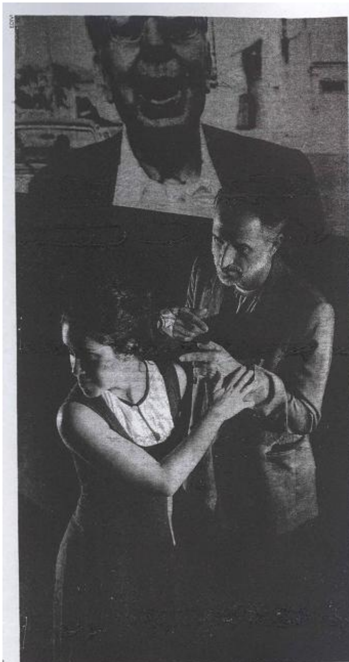
O anti. Ao contrário de outras obras de Nelson, espetáculo é menos controverso e tem até final feliz

Nelson Rodrigues / 100 anos / Grupos Experiência Subterrânea, Dearaquecia e Teatro que Roda / Espetáculo Anti-Nelson Rodrigues / Teatro Álvaro de Carvalho – TAC / Teatro da Igrejinha da UFSC