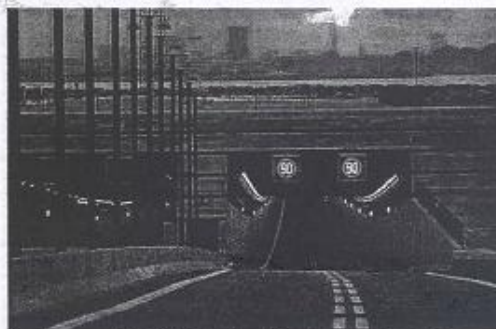
Sem alterar o calado. Túnel imerso tem 5,6 quilômetros de extensão

ESTRUTURA Projeto da engenheira Jaqueline Ferreira tem custo de R$ 2,5 bilhões