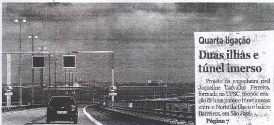
Tráfego. Duas pontes integram as ilhas artificiais e o túnel imerso