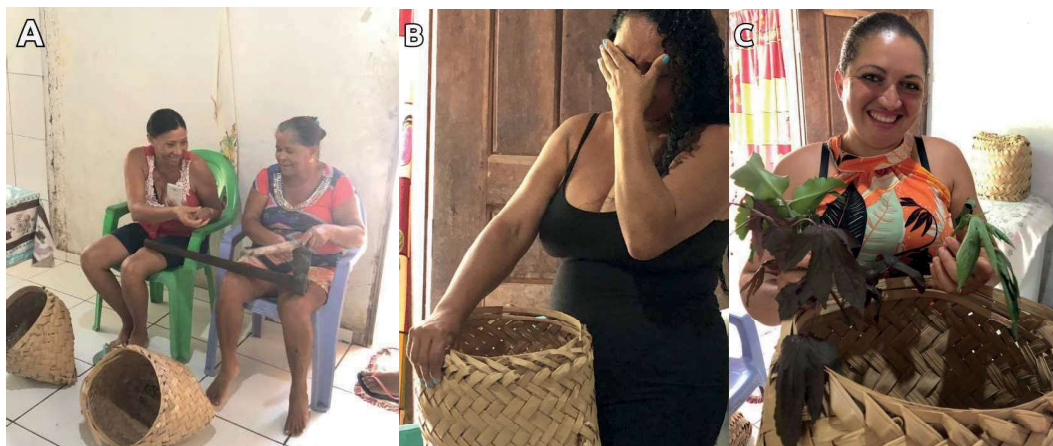
Figura 3 – Experienciando a prototipação. (Imagens A, B e C) Mulheres usando o Cofre de Histórias.

Um ponto de relevância diz respeito ao fato de que o grupo de mulheres envolvido na atividade aumentou em relação ao dia anterior. As participantes encorajaram outras moradoras de Monge Belo a também partilhar suas histórias de vida (Figura 3), assim como fez a personagem Dijé (observando aqui uma validação do nosso processo). Cada uma das mulheres nos trouxe uma visão de diferentes períodos daquela localidade, devido à variação de suas faixas etárias (entre 30 a 60 anos). Apesar das variações de idade, todas elas são mães.