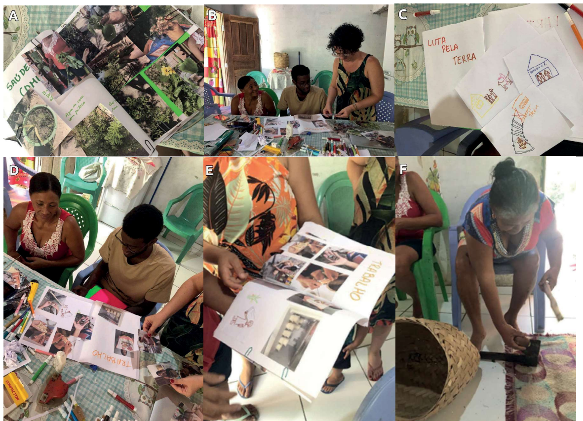
Figura 4 – Momentos de cocriação. (Imagens A, B, C, D, E e F): Elaboração do Livro da História das Mulheres de Monge Belo.

As narrativas que emergiram a partir do Cofo de Histórias e do livro A história das mulheres de Monge Belo são aqui apresentadas segundo os parâmetros da lacuna de gênero, sendo estas: saúde e bem-estar, educação, participação econômica e empoderamento político.