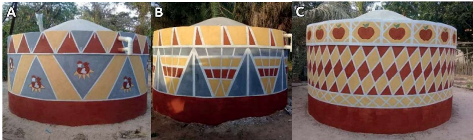
Figura 1 – (Imagens A, B e C): Cisternas em Monge Belo.

Fonte: Fotografias de Patrícia Rodrigues (Itapecuru Mirim, 2019).