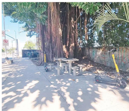
Veículos deixados em locais não marcados como estacionamento são motivos de reclamação