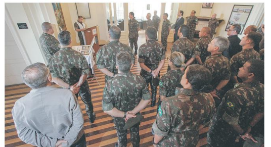
Sessão solene comemorou as cinco décadas de instalação do comando da Brigada Silva Paes no Centro de Florianópolis