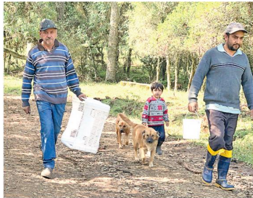
Diferentes gerações apostam na agricultura familiar catarinense

“Ser Sustentável” apresenta valores da agroecologia e revela experiências importantes e diferenciadas, evidenciando paisagens e culturas. Foram registradas iniciativas e histórias de vida e trabalho embasadas na produção, formação, comercialização, no meio rural e urbano. A produção recebeu recursos do Estado, por emenda parlamentar impositiva à Lei Orçamentária de 2021 do deputado estadual Padre Pedro Baldissera.