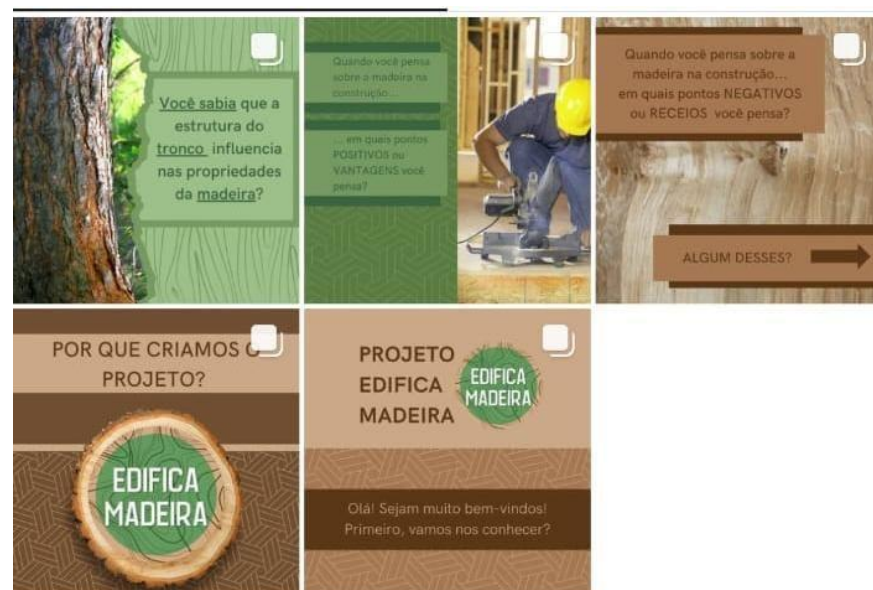
Figura 3: Postagens sobre a madeira na construção de edificações.