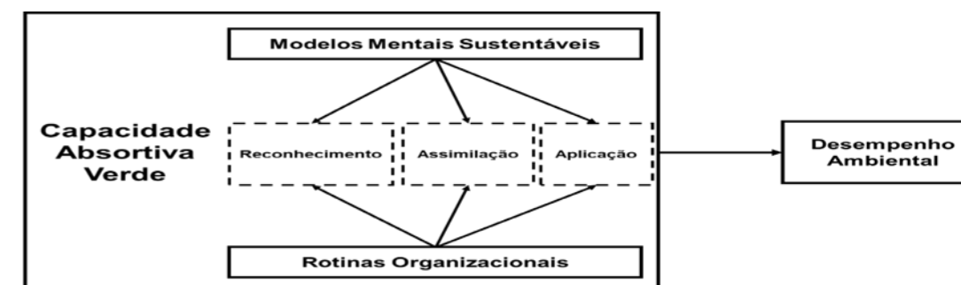
Figura 3. Modelo teórico proposto

conhecimento externo, e que possibilite aprender com parceiros, fornecedores, clientes, concorrentes e consultores. Vale ressaltar que as rotinas aqui são analisadas com base na visão de Felin et al. (2012) onde rotinas incluem componentes constituintes: indivíduos, processos e estrutura; e interações dentro e entre os componentes que contribuem para a agregação e construções coletivas. Ou seja, o que Lane et al. (2006) chama de Característica das Estruturas e Processos, neste trabalho é entendido, com base na definição de Felin et al. (2012), como Rotina Organizacional. Assim se propõe o seguinte modelo teórico.