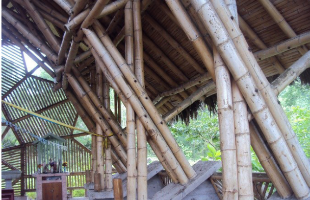
Figura 1 – Estrutura em bambu em processo de degradação

O bambu é um dos materiais naturais que tem sido empregado na construção há milênios graças a sua abundância, rápido crescimento, fácil manuseio, versatilidade, resistência e flexibilidade. Seu uso e aplicação misturam saberes populares com técnicas contemporâneas, resultando em edificações que se adaptam às mais diversas necessidades. No entanto, sua baixa durabilidade natural preocupa os projetistas e usuários.