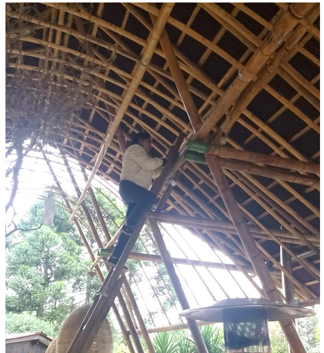
Figura 4 – Inspeção visual de estrutura de bambu

A inspeção visual é a técnica mais simples para verificação de sinais externos – rachaduras, descolorações, entre outros – nas peças que sejam indicadores de defeitos e ataques (ABREU et al, 2013; LIANG et al 2013).