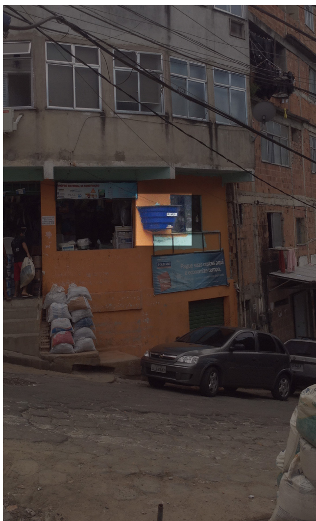
Figura 1 – Fotografia no final do percurso do Morro do Cantagalo, “elaborado pelo autor, com base na pesquisa realizada”

Na etapa 4 (quatro) de prototipagem realizada em conjunto com as artesãs moradoras do morro e que fazem parte do Museu de Favela, podemos conferir como o registro fotográfico de apenas um exemplo da caixa d'água marcou as artífices nas oficinas colaborativas enquanto analisavam as categorias referentes ao quadro 1.