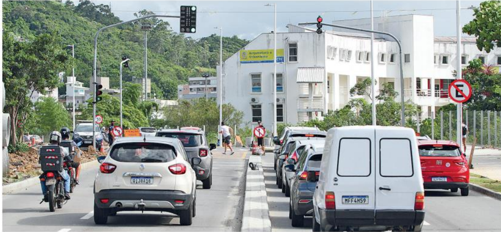
A rua Deputado Antônio Edu Vieira, que deve estar revitalizada até dia 23, também fará parte da nova alternativa para o trânsito local