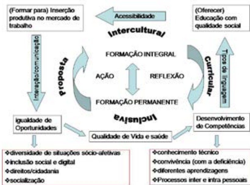
Quadro 1- Esquema da Caracterização transversal dos objetivos das Unidades de Operações Sociais (UOS) do SESI/SC.