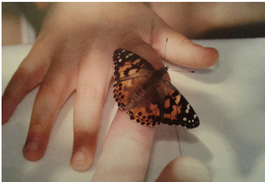
Figura 2: Natureza e o indivíduo. Fonte: COOPER MARCUS e SACHS (2014).

Com relação aos passos subsequentes da pesquisa, tem-se a aplicação dos questionários, a varredura das informações obtidas, o processo de transformação dessas informações em dados estatísticos e, por fim, a análise dos dados.