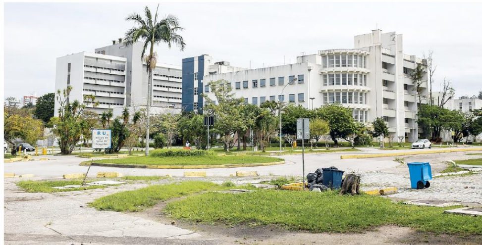
Na sociedade catarinense persiste a esperança de que a instituição federal volte a ser motivo de satisfação no Estado

Todos frequentaram as salas da UFSC. A lista de egressos notáveis é tão vasta quanto a admiração pelos que