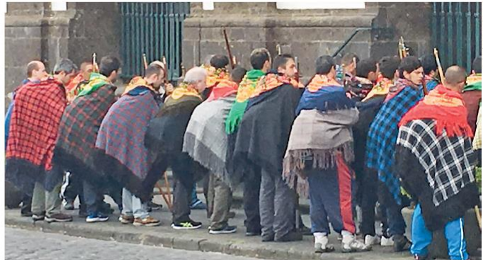
Na Ilha de São Miguel, homens e meninos percorrem o território por uma semana na quaresma, uma tradição de cinco séculos