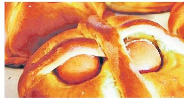
Folar, o pão onde o ovo é assado inteiro