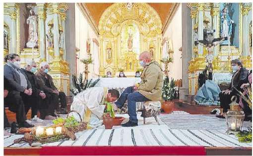
Lava-pés em Lajes das Flores, na Ilha das Flores, nesta sexta-feira