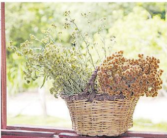
Colheita da macela na Sexta Santa é outro hábito herdado dos açorianos