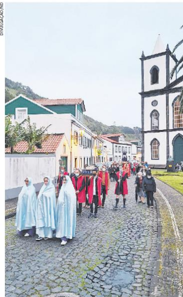
Procissão do Senhor Morto sai da Igreja São Matheus e percorre nesta Sexta Santa as ruas da Ilha do Pico