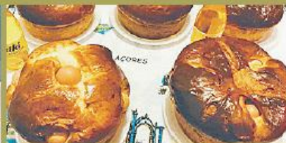
Bacalhau (à esq.) e folares, comidas típicas da Semana Santa

Uma das tradições mais antigas dos Açores são as Romarias na Ilha de São Miguel