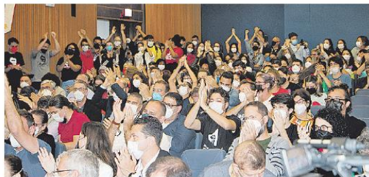
Sessão especial do Conselho Universitário da UFSC, ontem, definiu nomes, mas peso dos votos de professores e alunos está sendo questionado

Conforme noticiou o colunista Moacir Pereira, do ND, a consulta acadêmica, etapa preliminar à eleição no conselho universitário, foi questionada na Justiça, com ação