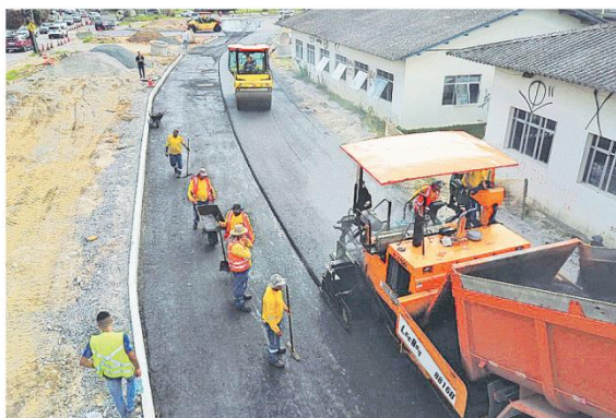
Operários trabalham em uma das últimas partes do trecho da duplicação da rua Edu Vieira que ainda estava sem asfalto

A empreiteira executora do pacote de obras da Edu Vieira, a Planaterra Terraplanagem e Pavimentação Ltda., vai paralisar as atividades para as festas de final de ano, retornando ao trabalho no dia 5 de janeiro. Na sequência, o trânsito será transferido para a nova pista da Edu Vieira para a revitalização da pista atual. Tal serviço deve ser concluído no primeiro trimestre de 2023.