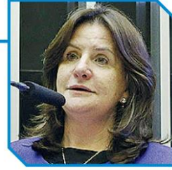
Carmen Zanotto, Secretaria do Estado da Saúde

Graduada em enfermagem e obstetrícia, tem especialização em administração hospitalar, saúde pública, recursos humanos e formação em políticas para primeira infância na Universidade Harvard, nos Estados Unidos. Atuou como enfermeira, diretora de enfermagem, secretária municipal de Saúde, secretária e adjunta da Secretaria de Estado da Saúde de Santa Catarina em diversos períodos. Como parlamentar, integrou o legislativo lajeano como vereadora e atualmente deputada federal. É considerada uma das pessoas que mais entende das políticas públicas de saúde no Brasil. Em 2022, Zanotto foi a principal parlamentar na luta e aprovação do piso nacional da enfermagem.