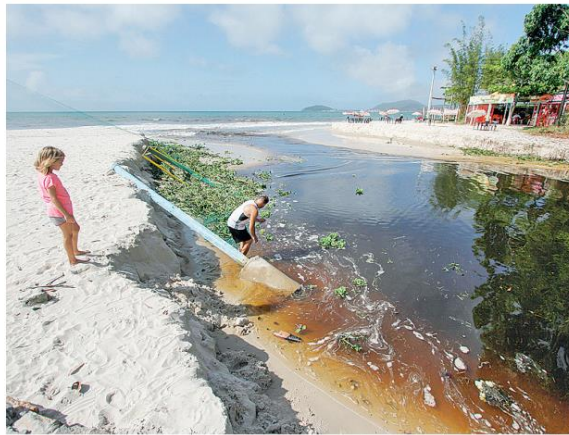
Com a força da água da chuva, na quinta, rio invadiu praia

A falta de oxigenação tem causado série de problemas. Macrófitas surgem e deixam o rio parecendo um tapete verde. Essas plantas surgiram na beira da praia após o rio transbordar.