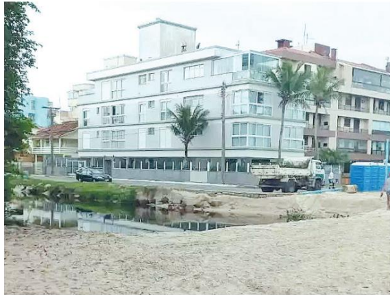
Na manhã de ontem, novo cenário, com uma barreira