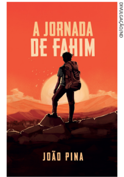
Capa do livro de 230 páginas

João Pina é graduado em relações internacionais pela UFSC e especializado em migrações transnacionais pelo programa Transnational Migrations, na Europa.