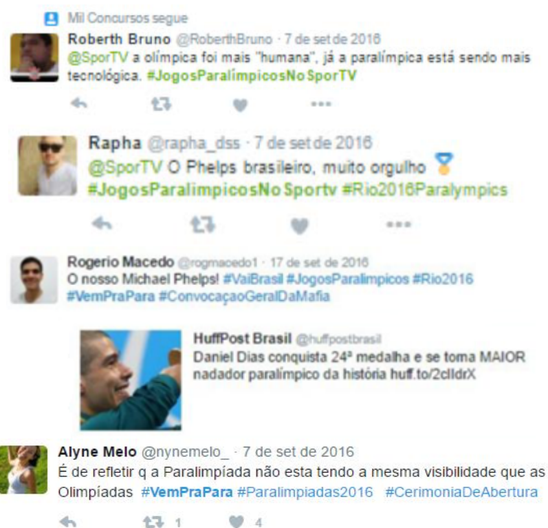
Figura 3. Exemplos de postagens da categoria Estigma.

Na última postagem da Figura 2 acima é possível verificar um outro exemplo de estigma que persegue e se manifesta com relação ao esporte e aos atletas paralímpicos. Este também é um formato recorrente de como o sentimento paralímpico se revela estar sempre em comparação ao megaevento e à manifestação esportiva correlata dele, que são os Jogos, o esporte e os atletas olímpicos. Em algumas postagens também foram feitas comparações entre elementos de ambas manifestações esportivas como podemos visualizar na figura 3 abaixo.