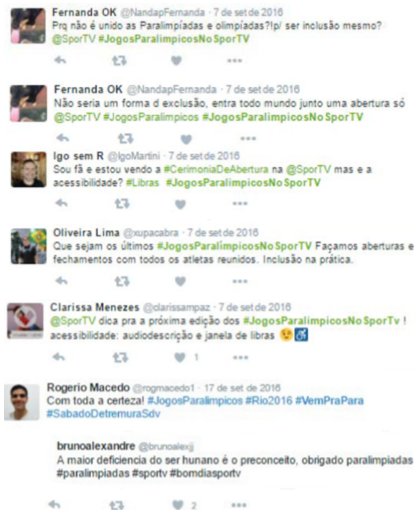
Figura 5. Exemplos de postagens da categoria Inclusão ou Segregação Social.

O sentimento paralímpico pôde ser manifesto através do Twitter pelo público que acompanhava as transmissões oficiais de uma forma que também questionava e criticava diferentes aspectos do contexto do paralimpismo. Entre eles estiveram questionamentos sobre a inclusão ou exclusão social de pessoas com deficiência através do formato que o megaevento é realizado, problematizações sobre acessibilidade, sobre preconceito e outros fatores.