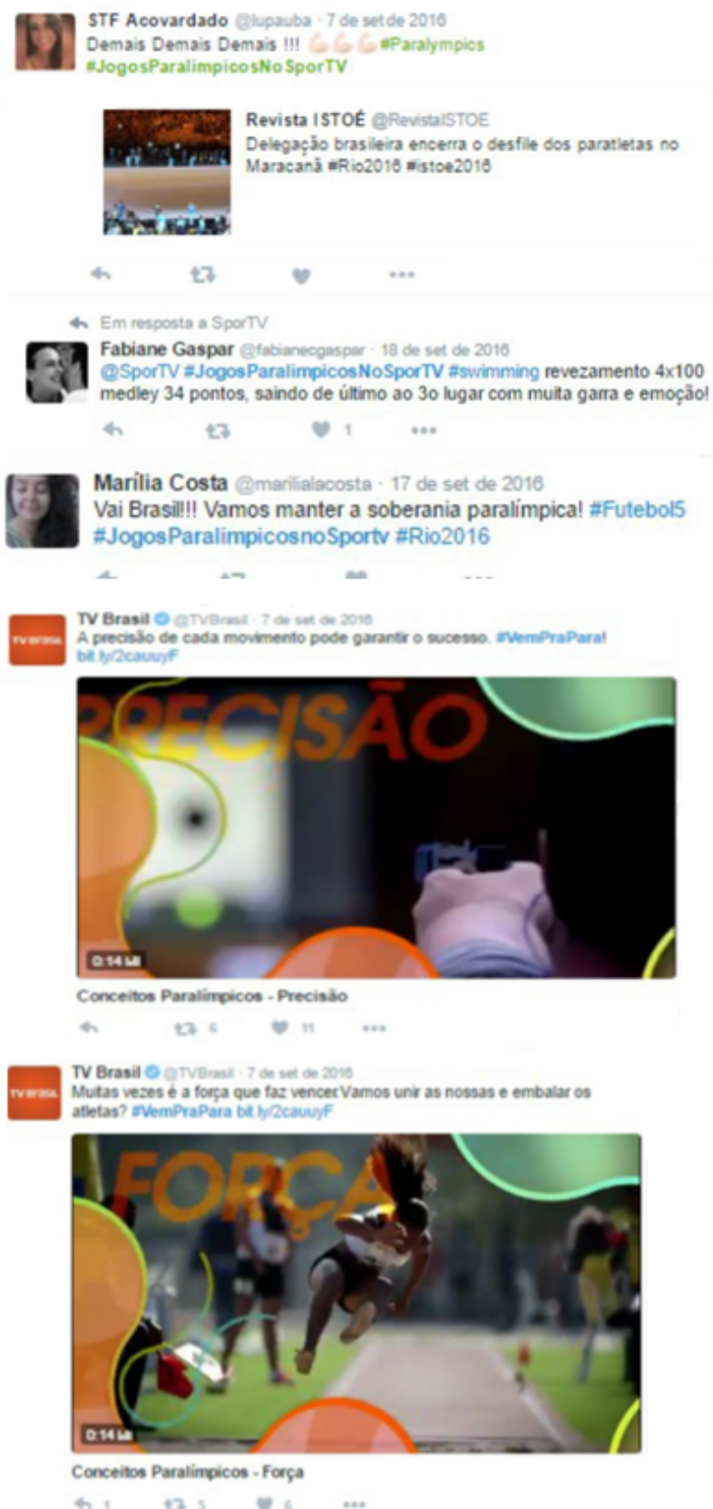
Figura 4. Exemplos de postagens da categoria Capacidades e Habilidades.

Existem ações internas do movimento paralímpico, baseadas em perspectivas de entidades diplomáticas mundiais como a Organização Mundial da Saúde (OMS), que têm orientado e sugerido maneiras mais indicadas para se referir e tratar as pessoas com deficiência de modo a estabelecer relações mais inclusivas