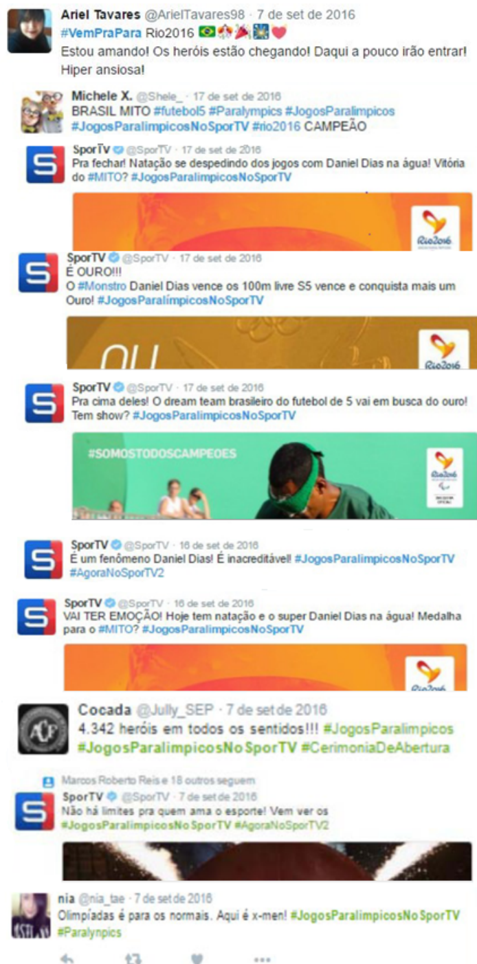
Figura 2. Exemplos de postagens da categoria Estigma.

O posicionamento dos atletas com deficiência como mitos, heróis e sobre-humanos, estes quando se faz menção à narrativa das histórias em quadrinhos e cinematográfica dos humanos mutantes com superpoderes, X-Men , aparece tanto em postagens do perfil oficial da emissora de TV fechada, como em publicações de internautas. Esta é uma característica que aparece com predominância e reincidência na narrativa midiática sobre o esporte e atletas paralímpicos, é o que se denomina como a narrativa do supervrip . Esta forma de se referir a eles é controversa entre os próprios personagens protagonistas do esporte paralímpico, os atletas. Uma parte dos atletas com deficiência gostam e acham importante este tipo de veiculação e compreensão sobre eles, pois acreditam que pode ser uma forma de inspirar mais pessoas com e sem deficiência a buscarem superar os seus limites. Outra parte não acha uma narrativa válida, pois gostariam de ser conhecidos somente como atletas de alto rendimento assim como todos os outros, que