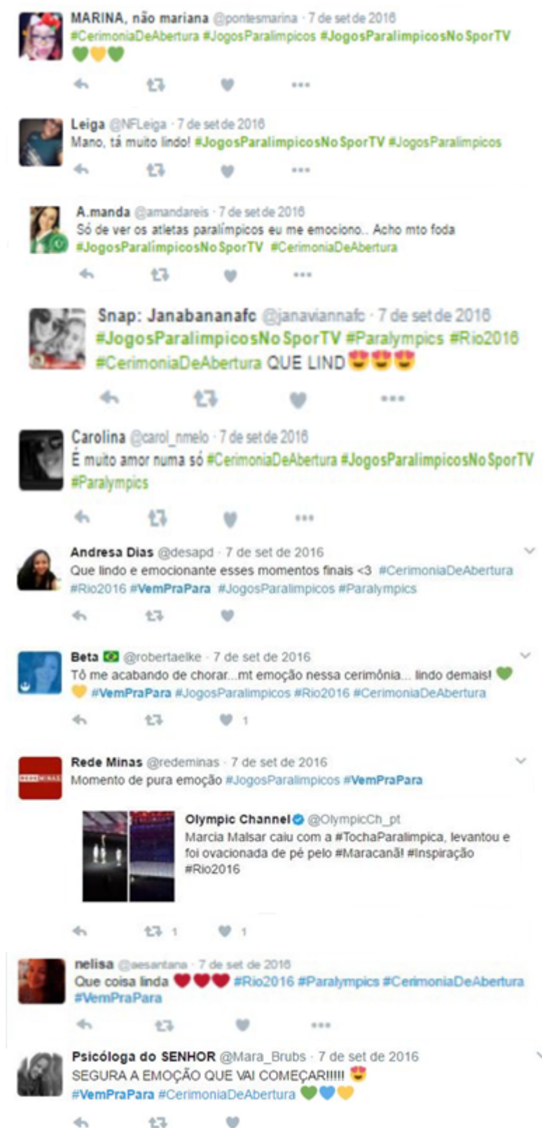
Figura 2. Exemplos de postagens da categoria Emoção.

Martín-Barbero (2004; 2009) argumenta que possuímos nexos simbólicos para leitura e interpretação dos diversos fenômenos da nossa cultura que são conformados e estabelecidos nas nossas matrizes culturais. São gramáticas de ação – do escutar, do ler, do olhar – expressas nos sentidos humanos, que