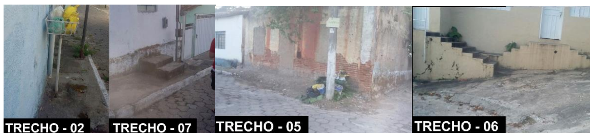
Figura 3: Entraves ao deslocamento em diferentes trechos.

Procedeu-se, portanto, ao levantamento analítico de cada um dos dezessete trechos que compõem os trajetos elencados, segundo as onze categorias e seus cenários, obtendo as notas parciais por categoria e as notas finais de cada trecho, conforme descrito no Quadro 2. De posse dessas notas, fez-se necessária a composição das notas de cada um dos percursos. O percurso ‘residência-mercado’ - composto pelos trechos 1, 2, 3, 4, 5, 6, 7 e 8 – teve nota final 1,51; o ‘residência-hospital’ - pelos trechos 1, 2, 9, 12, 15, 16 e 17 – teve nota 1,79; o ‘residência-lazer’ - pelos trechos 1, 2, 9 e 12 – nota 1,65; o ‘residência-banco’ - por 1, 2, 9, 13 e 14 – nota 1,78; e, por fim, o percurso ‘residência-escola’ – que se compôs pelos trechos 1, 2, 9, 10 e 11 – teve nota 1,26, conforme mostra o Quadro 3. Uma ilustração dos principais entraves ao deslocamento encontrados nos trechos aparece nas imagens que compõem a Figura 3, abaixo.