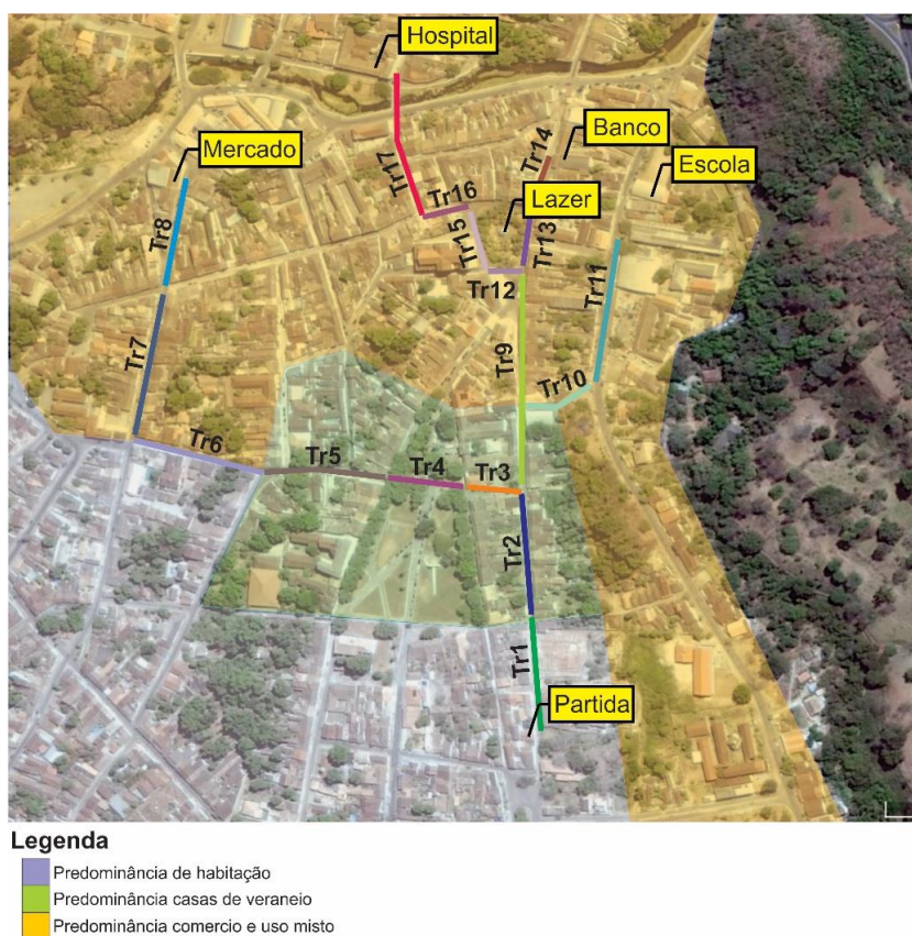
Figura 1: Percursos analisados na cidade de Goiás divididos em trechos.

O processo analítico da caminhabilidade proposto neste trabalho parte de uma primeira categoria de análise pouco mencionada nos estudos consultados: a distância dos percursos. Para a avaliação da caminhabilidade na cidade de Goiás, foram elencados cinco percursos em seu centro histórico, que simulam trajetos cotidianos a partir de um ponto inicial - uma casa -, escolhida estrategicamente em uma área de predominância residencial. Tais trajetos compreendem o acesso de menor distância aos exemplares mais próximos do referido ponto que possuem a seguinte natureza: uma escola, um espaço de lazer, um estabelecimento de saúde, um mercado e uma agência bancária conforme apontado na Figura 1. Dessa forma, o primeiro item analisado é se esses estabelecimentos, recorrentes no dia-a-dia do cidadão se encontram a uma distância convidativa ao deslocamento pedonal, favorecendo a caminhabilidade.