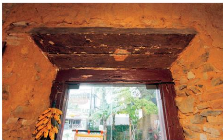
Antes do vidro para clarear os ambientes, aberturas eram fechadas com madeira, matéria-prima farta na região

“No princípio, as casas luso-brasileiras do período colonial podiam ser térreas ou sobrados, e estavam dispostas em lotes estreitos e profundos, onde as fachadas frontais conformavam as ruas das vilas ou núcleos urbanos, já que as edificações eram construídas sobre os limites laterais do terreno umas junto às outras, de forma geminada”, conta Suzane. “Tinham cobertura em duas águas, com caimento de frente para a rua e nos fundos para o quintal, evitando a necessidade de uso de sistema de captação ou condução de águas pluviais. No caso das casas térreas, a distribuição interna se dava por uma sala frontal, seguida das alcovas (que eram cômodos fechados, sem janelas) e nos fundos a cozinha, sendo a circulação realizada por corredor lateral ou central”.