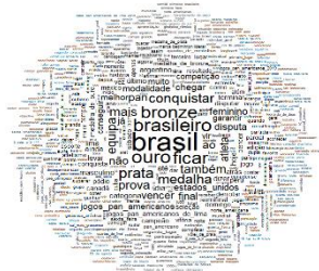
Figura 4. Nuvem de palavras construída a partir do corpus textual da cobertura jornalística dos Jogos Parapan-Americanos 2019.