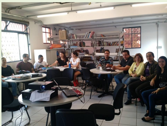
Reunião do Grupo realizada no dia 29/05

Pesquisa vinculada ao Centro MG da Rede CEDES: "Vivências Culturais e Lazer em Vilas do Programa Judicial para Remoção e Reassentamento Humanizado de Famílias do Anel Rodoviário e BR-381 em Minas Gerais"