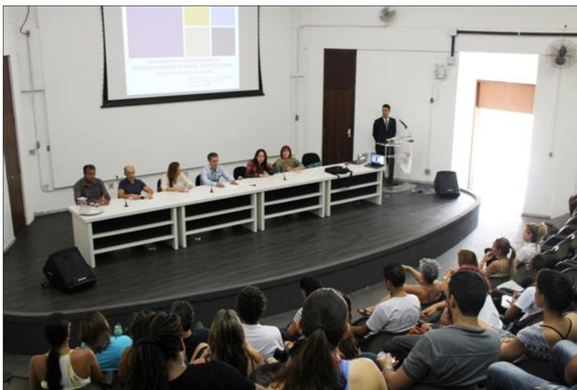
Foto da Palestra