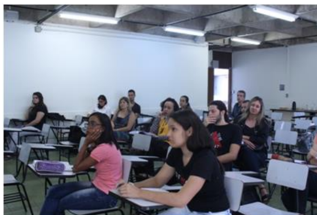
Arte da placa de identificação (em confecção)

CENTRO DE DESENVOLVIMENTO DE PESQUISAS EM POLÍTICAS DE ESPORTE E DE LAZER DA REDE CEDES DO ESTADO DE MINAS GERAIS