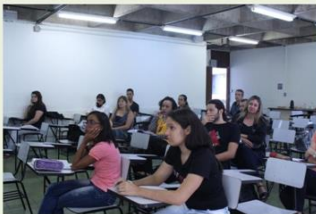
Bolsistas e professores integrantes do Centro MG participaram da reunião

Os integrantes do Centro MG da Rede CEDES se reuniram pela manhã na EEFFTO para realizar uma reunião interna e tiveram como pauta a discussão sobre o planejamento e atividades realizadas em 2016 e o cronograma dos grupos para 2017, além de informes e atualizações sobre as ações do Centro MG.