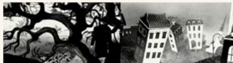
Imagem 3: Cenários do filme Persépolis.

os cenários distorcidos, expressionistas, do filme, que rejeitavam qualquer pretensão de realismo, a narrativa fragmentada, as atuações hiperestilizadas e a sensação de insegurança paranoica se uniam para expressar a atmosfera de uma nação derrotada, traumatizada, sem confiança na própria identidade, vendo inimigos tanto internos quanto externos (KEMP, 2011, pp. 42).