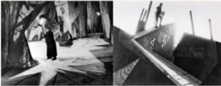
Fonte: O GABINETE DO DR. CALIGARI, 1920.

Retratando diferentes regimes entre eles uma monarquia e depois uma teocracia onde prisões de opositores eram comuns, vale correlacionar os fatos do filme com os conceitos elaborados pelo filósofo italiano Giorgio Agamben. Na película, o Tio Anouche, como também uma personagem posteriormente introduzida, Niloufar, foram executados pelo regime por serem contrários a suas ideias.