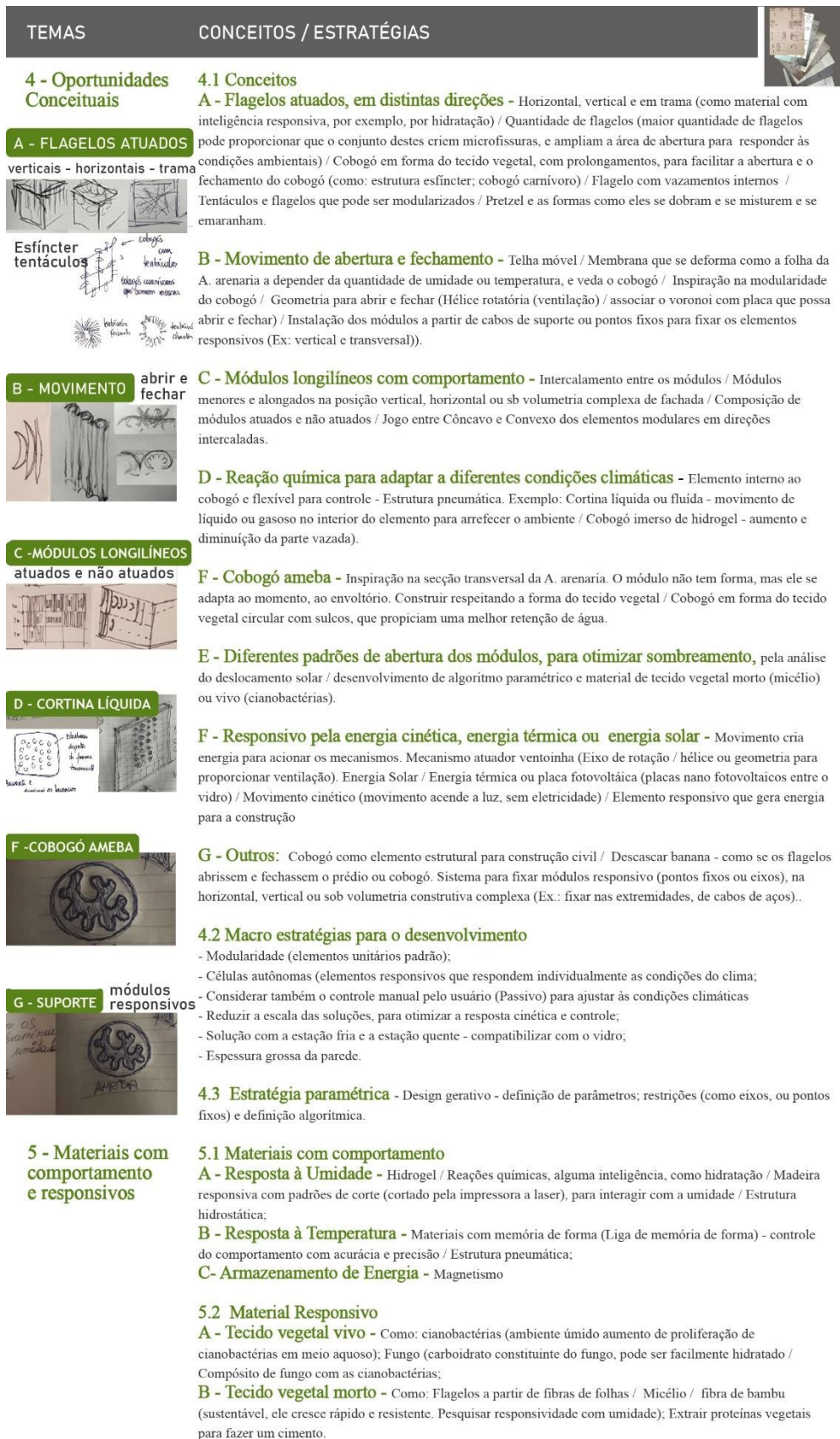
Tabela 7. Síntese das oportunidades conceituais e materiais. Fonte: autores.