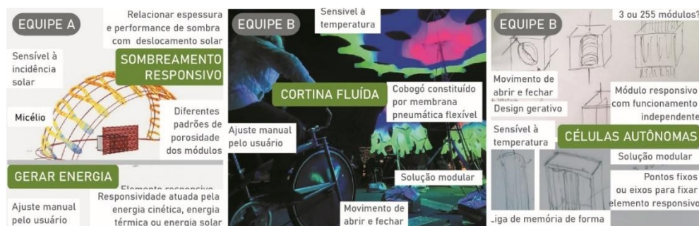
Imagem 3. Síntese dos conceitos criados na Etapa 3 de cocriação.

Não chegaram a definir o material, mas cogitaram utilizar o tecido vivo (compósito com cianobactérias entre o vidro, que se proliferam segundo à umidade) ou o tecido vegetal o morto, o mycelium (estrutura radicular de cogumelos (rede de raízes), que à medida que crescem colaboram para a limpeza do ar).