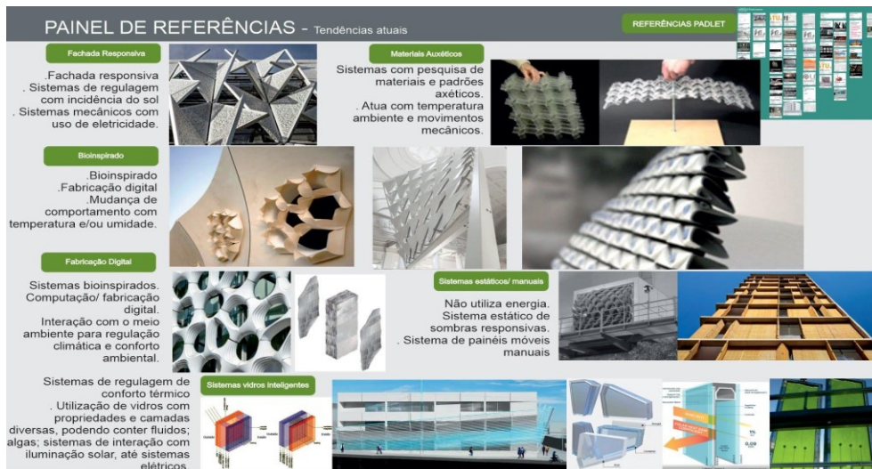
Imagem 1. Apresenta referências disponibilizadas durante a Etapa 1.

A segunda etapa corresponde à definição do organismo de referência e geração de ideias. Apresentamos gramínea Ammophila arenaria como organismo para bioinspiração.