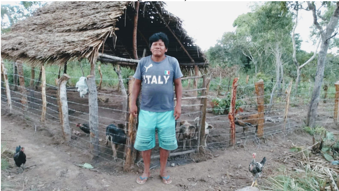
Figura 2: Criação de suínos