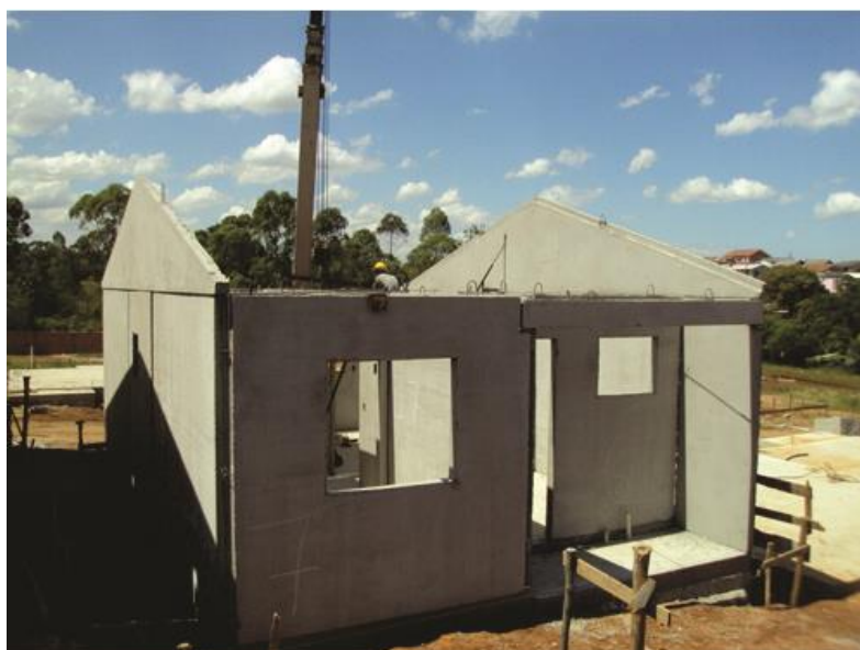
Figura 1: Habitação de Interesse Social na fase de construção.

A habitação a ser analisada pertence ao Santa Luzia Condomínio Residencial e possui 49,46 m 2 de área construída. O sistema construtivo utilizado foi paredes pré-moldadas de concreto com 10 cm de espessura sobre uma laje do tipo radier, também de concreto, conforme figura 1. O subsistema cobertura é constituído por um telhado cerâmico, com telhas do tipo portuguesa, duas águas sustentadas por uma estrutura de madeira, com 1,70 m de altura e forro de PVC, conforme figura 2. Nas janelas externas foram utilizadas esquadrias de alumínio com venezianas e vidros comuns transparentes de 4 mm. As portas são de madeira.