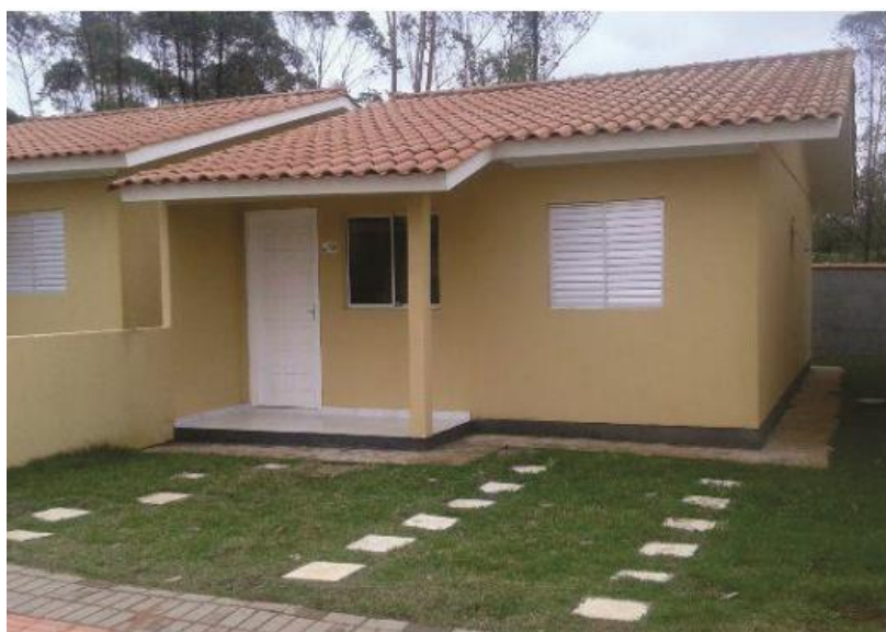
Figura 2: Habitação de Interesse Social após conclusão da obra.