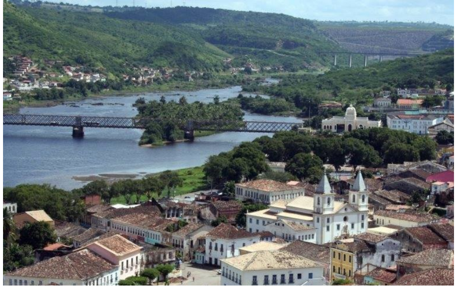
Fig. 1. Jomar Lima, “Cachoeira, rio Paraguaçu, ponte D. Pedro II e barragem da UHE Pedra do Cavallo” (2006).

história “poética” de Rubens Rocha (2015), que transborda topofilia quando se refere à Cachoeira como “Joia do Recôncavo”.