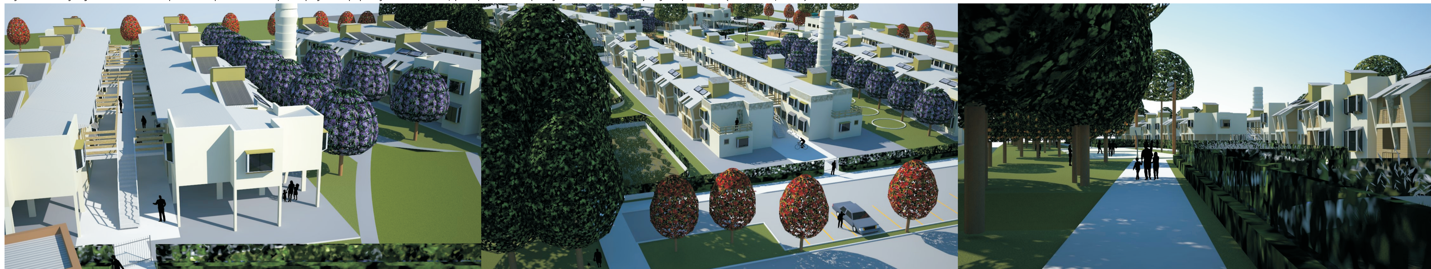
Apartamentos com 1 dormitório

A execução de terraços jardins é mais um processo que buscará a participação da população interessada, para possível reaplicação também nas ampliações previstas. (LOHMANN, 2008).