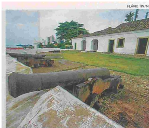
Forte Santana do Estreito já começou a ser reformado