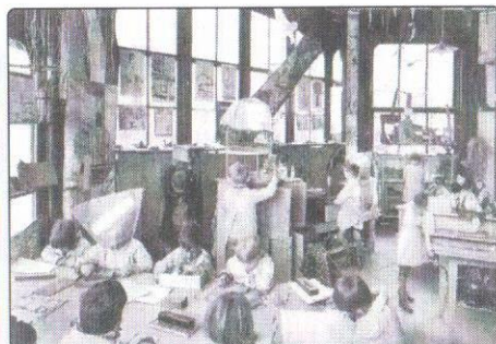
Imagem 2: Ilustrações do Método Decroly.

verdade silenciando potenciais agentes de poder. O teatro da memória é eminentemente político. (SELIGMANN-SILVA, 2008, p. 6 e 7).